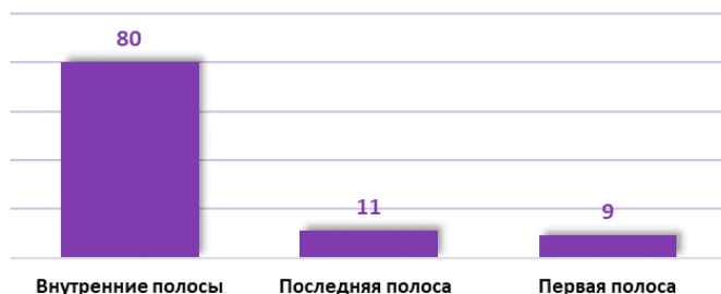
РАЗМЕЩЕНИЕ В ГАЗЕТЕ

Большинство материалов, опубликованных этими тремя газетами (70), появились в рубрике «Социальное», а остальные в таких рубриках, как «Политическое», «Образование», «Культура» и пр. При этом около 90% журналистских материалов авторские — они были подготовлены сотрудниками редакций трех периодических изданий.