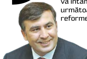
Mikheil Saakashvili, Președintele Georgiei

„Și noi am făcut reforme în mai multe domenii. Important este să eliminați corupția, dar asta nu se va întâmpla în perioada imediat următoare, ci în câțiva ani, fiindcă reformele durează”