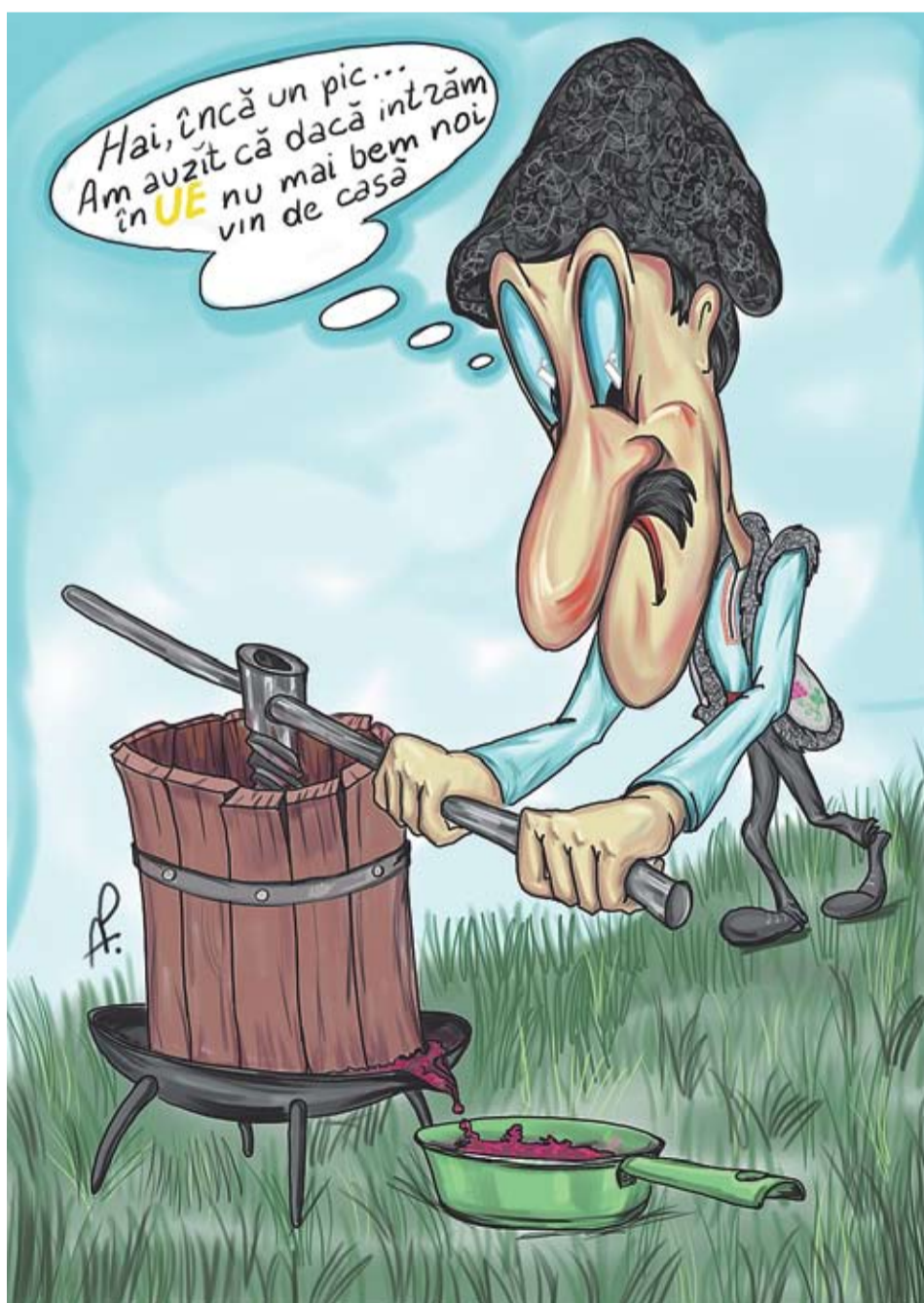
Caricatură: Alexandru Plișcină

ADEVĂR: Europa este un spațiu în care coexistă oameni de diferite categorii sociale, cu un nivel diferit de venituri. Poți să stai într-un hotel scump, dar și într-un hostel de 10-15 euro/noaptea ori să apelezi la un program de găzduire în familii. Poți să iei masa într-un restaurant de top, dar și să mănânci pe săturate într-un fast-food. Iar ca să te deplasezi spre Europa poți alege de la maxi-taxi până la avion. Datorită liberalizării spațiului aerian, un zbor spre Italia, planificat din timp, te costă până în 50 de euro. Și, apropo, în majoritatea capitalelor europene există o duminică pe lună în care intrarea în toate muzeele e gratuită. Încercați și vă veți convinge!