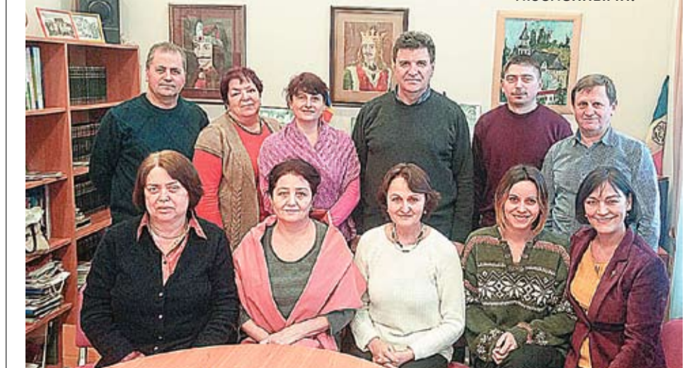
Диктант по румынскому языку объединил в текущем году молдаван, обосновавшихся в Литве.

По данным переписи населения 2001 года, в общем в разных населенных пунктах Литвы проживали около 700 выходцев из Республики Молдова. Члены Ассоциации «Dacia» имеют обыкновение называть себя «эмигрантами по любви», поскольку переселились в эту страну, следуя за своими возлюбленными.