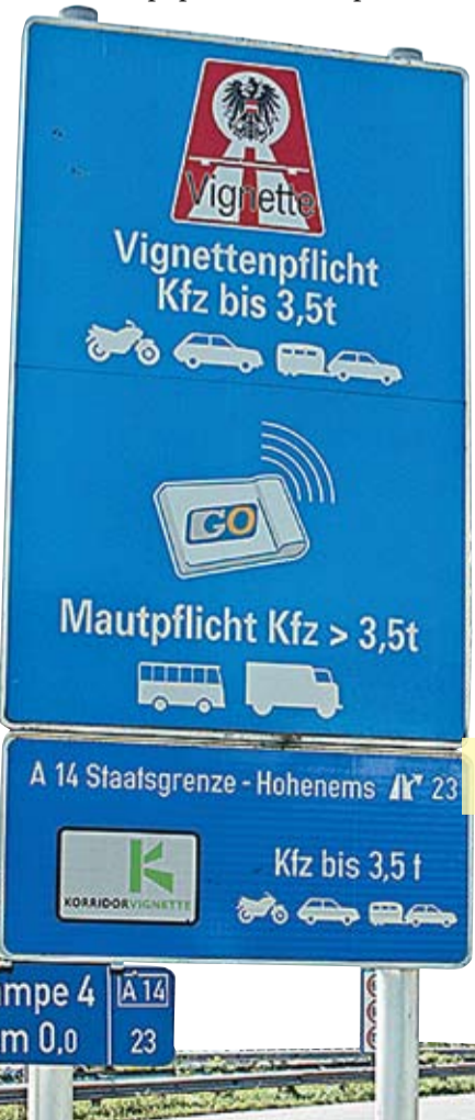
Указатель платного пользования дорогой в Австрии.

Общая протяженность сети автомобильных дорог Германии составляет 13 тысяч км, это одна из самых длинных сетей в мире. Согласно portalu www.tolls.eu, не все 28 государств Европейского союза взимают плату за пользование автострадами. Дороги бесплатные в следующих странах: Андорра, Эстония, Финляндия, Кипр, Лихтенштейн, Люксембург, Мальта, Монако, Сан-Марино и Ватикан. Тем не менее, есть страны, в которых взимаются определенные сборы за пользование мостами и туннелями: Албания, Бельгия, Дания, Швеция, Литва и Латвия (для автомобилей грузоподъемностью в 3,5 тонны), Исландия, Черногория и Голландия.