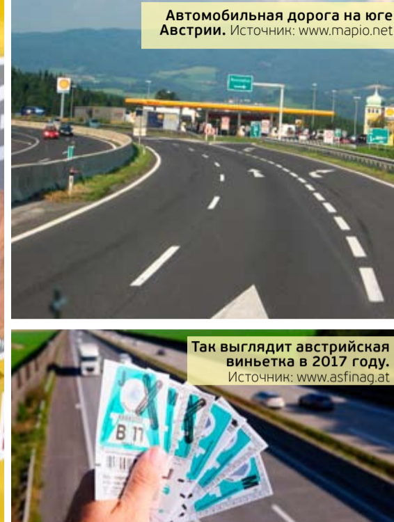
Автомобильная дорога на юге Австрии.

вития экономики страны Германия нуждается в дополнительных инвестициях в размере не менее 6,5 млрд. евро в год на содержание транспортной сети, согласно исследованию, проведенному берлинским институтом DIW. Это обусловлено износом инфраструктуры вследствие езды по немецким дорогам, около 44 миллионов автомобилей в год.