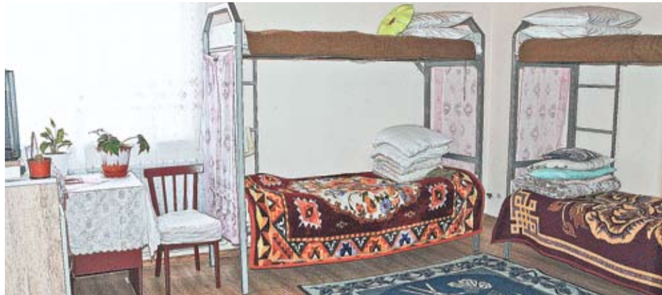
Модернизированный корпус Пенинциара в селе Руска рассчитан на размещение 20 человек.

Мария, другая молодая заключенная, родом из района Синджерей и отбывает наказание за то, что, находясь за рулем автомобиля, сбила насмерть пешехода. Хотя в здании, заменившем ей на время родной дом, созданы современные бытовые условия, 23-летняя женщина не преминула заметить – словно в назидание всем тем, кто находится на свободе, - что дома лучше всего... «Да, между нашими комнатами и «обычными»