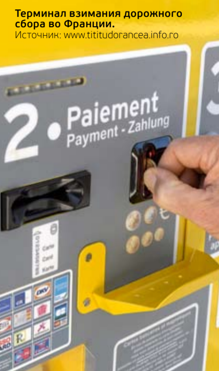
Терминал взимания дорожного сбора во Франции.