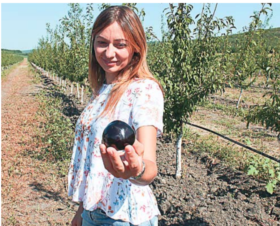
Первые сливы собранные семьей Кишкэ.

История Родики и ее мужа Василия аналогична историям тысяч молдаван, решивших уехать на заработки за рубеж, чтобы обеспечить себе лучшую жизнь. Он уехал первым, еще будучи холостяком. Она была студенткой – училась в Кишиневе, но решила последовать за ним. «До сих пор чувствую метлу, которой меня огрела мама по спине, когда я заявила ей, что хочу уехать», – вспоминает Родика с улыбкой. Уехать уехала, но не бро-