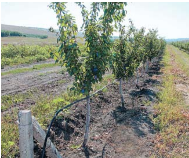
Система орошения в садах семьи Кишкэ