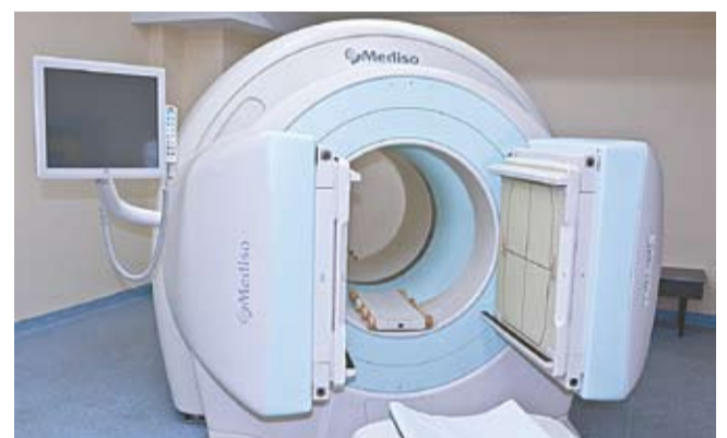
Современный диагностический аппарат для различных заболеваний, включая онкологические.