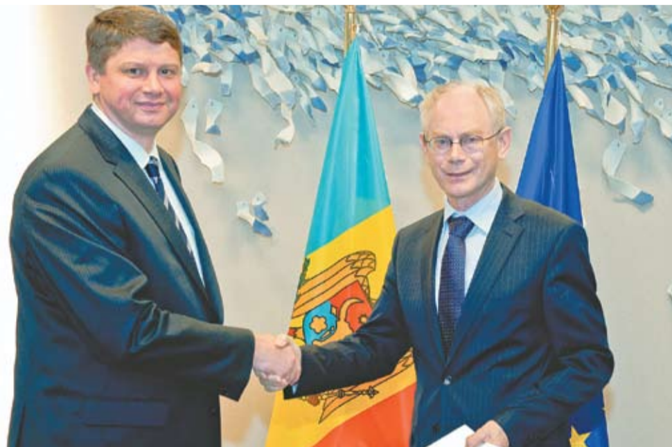
Вместе с Херманом Ван Ромпем, Председателем Европейского совета

— Ратификация соглашения имеет особое значение для институционализации