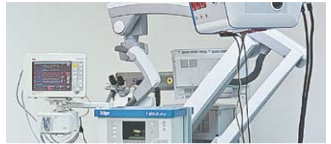
Приборы по диагностированию различных заболеваний, позволяющие выявлять болезни даже на начальной стадии развития.