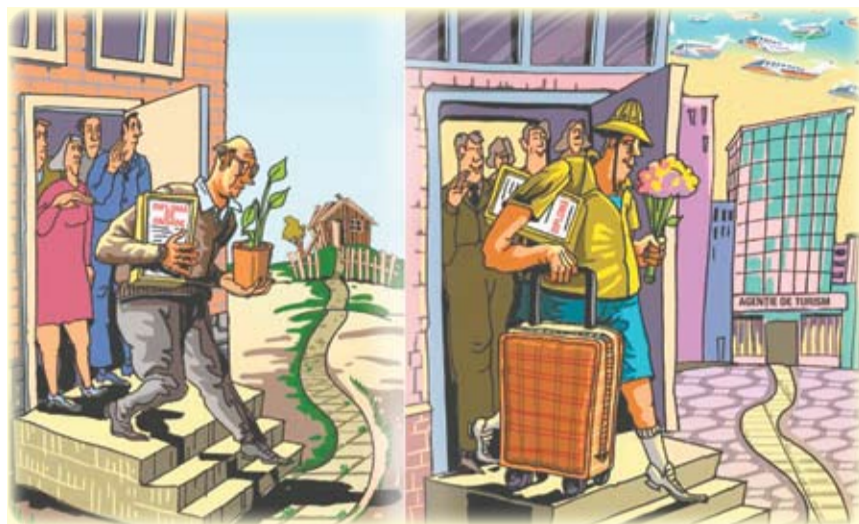
Карикатура: IDIS «Viitorul» и Institute of World Policy (IWP) из Украины

В государствах Европейского союза средняя продолжительность жизни достигает 77 лет (мужчины) и 83 года (женщины). В Республике Молдова этот показатель составляет 68,1 лет для мужчин и 75,6 лет для женщин. В Европейском союзе люди живут в среднем на 10 лет больше чем в Украине и на 13 лет больше чем в России.