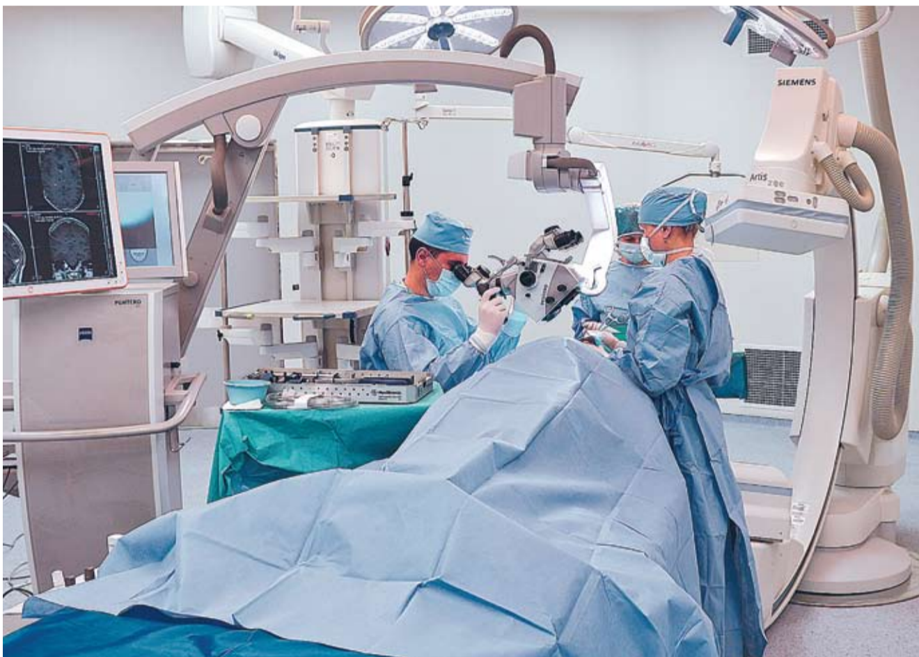
Гибридный операционный зал кишиневской Республиканской клинической больницы.