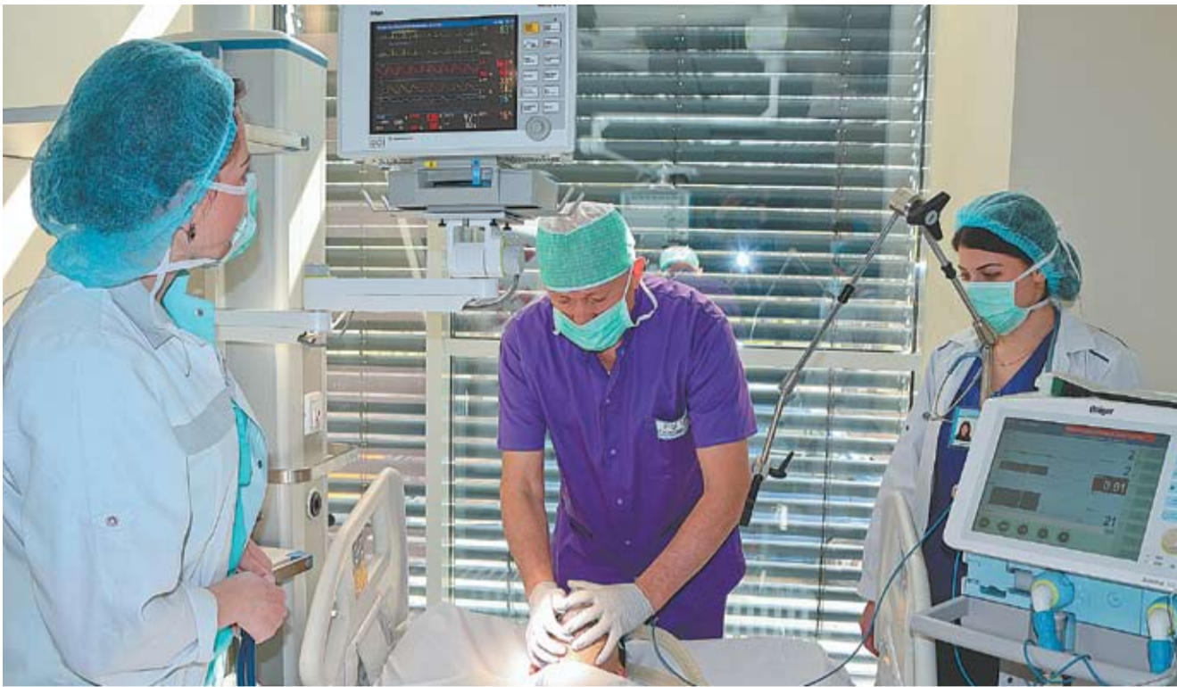
Зал анестезии Республиканской клинической больницы.