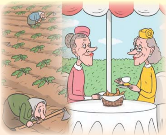
Карикатура: IDIS «Viitorul» и Institute of World Policy (IWP) из Украины

Европейский союз занимает первое место в мире по оказанию социальной помощи своим гражданам - 30% ВВП (по данным «Eurostat»). В Республике Молдова этот показатель составлял 13,5% в 2011 году. Данное расхождение сильнее всего заметно по разделу пенсий. В Германии минимальная пенсия составляет 350 евро (даже для тех, кто не проработал ни единого дня и не выплачивал взносы в бюджет социального страхования), средняя пенсия - около 800 евро в месяц. Во Франции минимальная пенсия составляет 500 евро в месяц, в Великобритании - 760 евро. В Республике Молдова среднемесячная пенсия составляла в 2013 году 50 евро (957,6 леев).