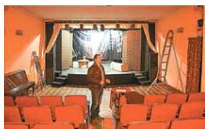
Peste un an, Teatrul din Cahul va avea casă nouă, o clădire modernă și spațioasă.

este ridicată pe locul unde s-a aflat vechiul sediu al instituției, care a funcționat aici până la sfârșitul anilor '90. Dar, într-o bună zi, trupa a fost alungată de acolo: au făcut-o... fisurile mari ce au apărut în pereți, vechiul edificiu, cu o istorie bogată în spate, datând încă din perioadă interbelică. Ca o soluție temporară, actorii s-au aciuat în clădirea fostei judecătories a raionului, veche și ea, însă actorii au cârpit-o pentru a putea lucra. „Din două săli de ședințe am făcut o sală de spectacole cu o capacitate de o sută de locuri. Când sunt mai mulți spectatori, punem