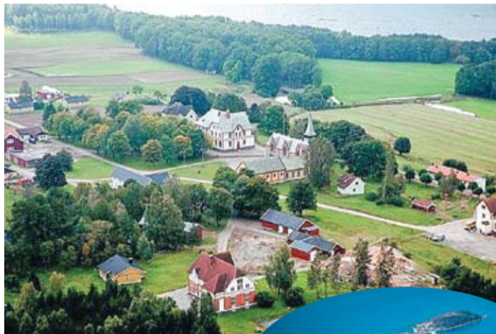
Închisoarea Bastoy, văzută de la înălțime: terenuri agricole, pădure și 80 de clădiri.

Deținuții se trezesc singuri, merg la școală, se plimbă prin pădure, înoată sau privesc televizorul. Deși nu au dreptul la telefoane mobile, dispun de cinci cabine telefonice, notează blogul victorkapra.ro . În ceea ce privește munca propriu-zisă, ei pot alege dintr-o varietate de activități - păstoritul oilor, îngrijirea cailor, cultivarea fructelor și legumelor, asigurarea curățeniei, vopsirea caselor, munca în atelierul de tâmplărie. Pentru aceasta, le este asigurat un venit lunar, din care își cumpără hrană de la un magazin situat pe insulă și pregătesc mesele zilnice. Astfel, sunt convinși autorii acestui concept, deținutul va fi motivat să se schimbe din propria dorință, nu forțat de cineva.