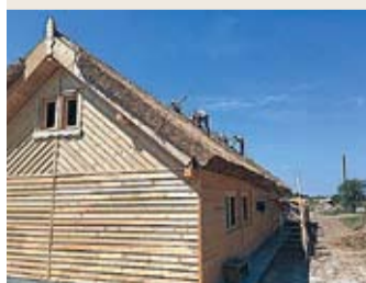
Prima casă ecologică și tradițională, construită de deținuți în România la îndrumarea unor meșteri locali.

Practica norvegiană a fost preluată și de România. Și aici, 115 persoane, aflate în ultimul an de detenție în penitenciarele din toată țara, s-au oferit voluntare pentru a ajuta la construcția unui sat turistic, Tătaru. Timp de trei luni, opt ore pe zi, deținuții au reușit să ridice un centru de meșteșugărit. Seara aveau liber, iar noaptea și-o petreceau în penitenciarul Chilia Nouă, aflat la câțiva kilometri. La sfârșitul stagiului deținuții sunt evaluați și cei care dovedesc că au dobândit cunoștințe în construcții (instalații, zidărie, dulgherie) primesc un certificat ca „finisori case”. Dacă respectă regulile, cât timp muncesc la Tătaru, primesc o reducere a pedepsei cu 20 de zile.