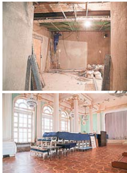
Pentru că Sala cu Orgă este în reparații, melomanii sunt așteptați în incinta Muzeului de Artă din Chișinău pentru a vedea spectacolele.

„Am început construcția exact cu un an în urmă.