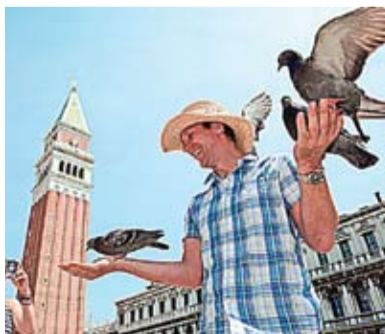
În Veneția este interzisă hrănirea păsărilor.