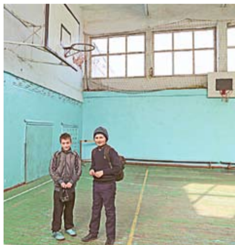
Elevii din Crihana Veche nu mai practică educația fizică în sala de sport, deoarece acoperișul clădirii este fisurat.

jilave. „Dacă pe timp de vară ploua mai multe zile, pe podea creșteau ciuperci. Nu, nu glumesc, acoperișul sălii de sport nu a fost reparat capital de când a fost construită sala, de prin anii 1980”, mai adaugă directoarea liceului.