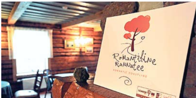
Traseul romantic adună laolaltă valori culturale, istorice și naturale.