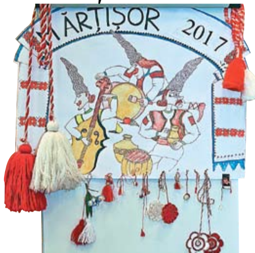
Expoziție de mărțișoare organizată de diaspora moldovenilor și românilor din orașul Vilnius, Lituania.