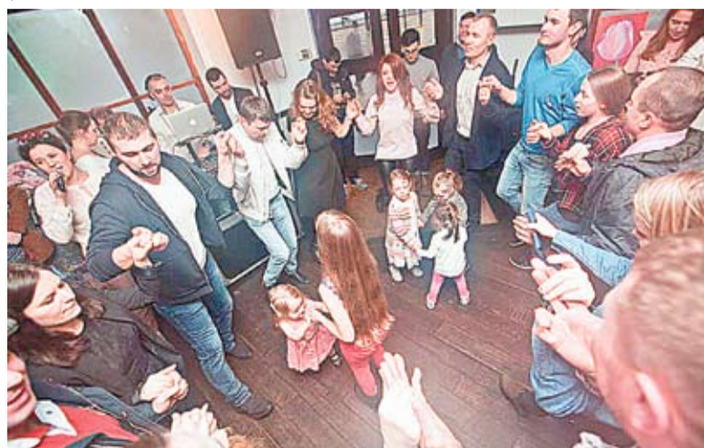
La sărbătoarea Mărțișorului din Londra moldovenii au încins hore și sârbe.