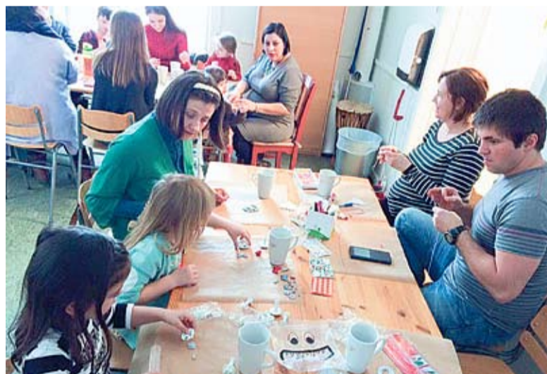
Participanții șezătorii de la Oslo au confecționat mărțișoare și au decorat câni.