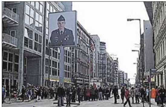
Astăzi o atracție turistică