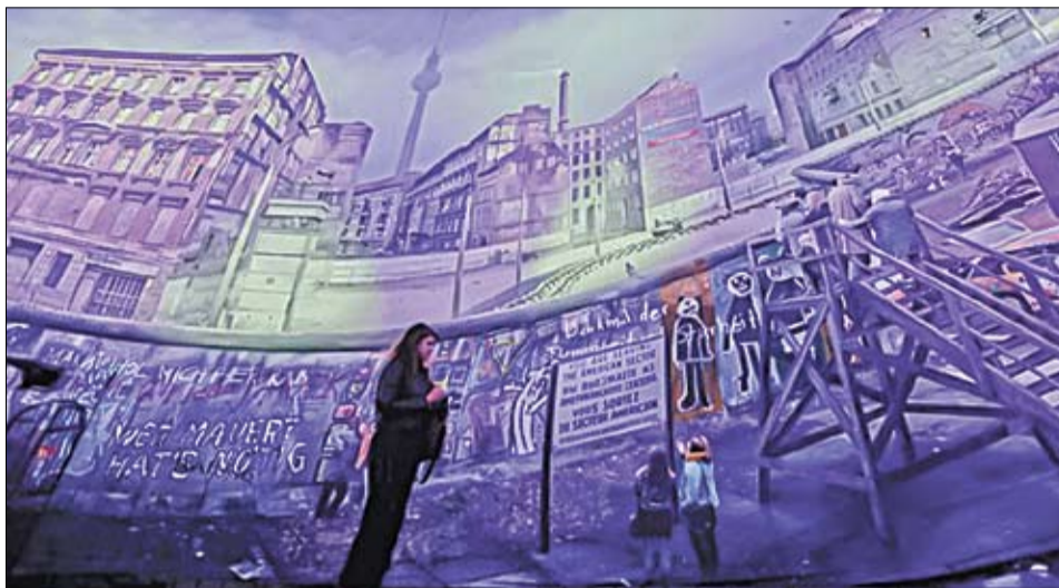
Normalitate devenită absurd

Checkpoint Charlie, cel mai cunoscut punct de frontieră pe Zidul Berlinului și un simbol de referință al Războiului Rece, reînvie istoria și devine, astfel, un nou punct de atracție pentru locuitorii și vizitatorii capitalei germane. În ajun de 3 octombrie 2012, când pentru a 22-a oară a fost serbată Ziua Unității Germane, aici a fost inaugurată o uriașă panoramă, realizată de celebrul artist berlinez de origine iraniană Yadegar Asisi, care înscenează „în mărime naturală” viața de zi cu zi în jurul Zidului, în anii '80. Zidul Berlinului a căzut la 9 noiembrie 1989.