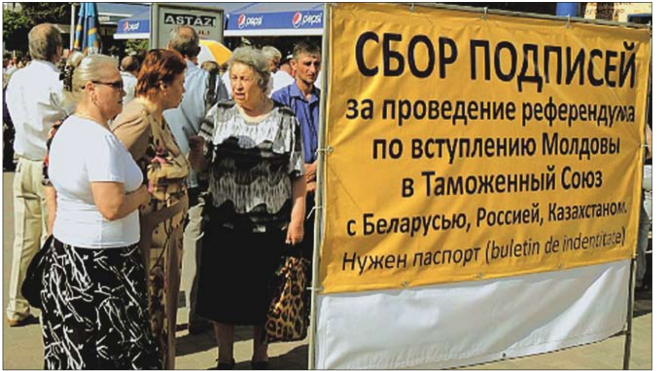
Trecutul vrea să ne ducă în Siberia