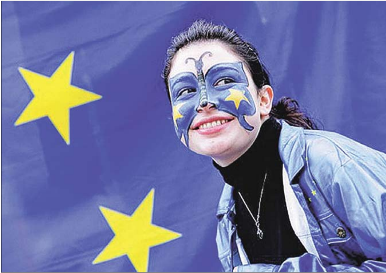
Viitorul ne cheamă în Europa

• un volum de investiții directe în străinătate efectuate de statele UE în valoare de $9,524 trilioane.