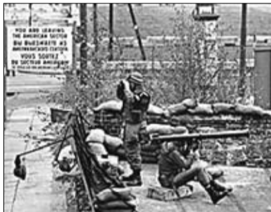
Punctul de frontieră Checkpoint Charlie, în 1961, la scurt timp după divizarea Berlinului

„O nouă atracție turistică pentru capitala Germaniei și o întoarcere în timp, la cea mai urâtă perioadă a Berlinului, de după cel de-al doilea Război Mondial”, titrează Deutsche Welle. Asisi înscenează pe 900 de metri pătrați o zi obișnuită din jurul Zidului Berlinului, în RDG-ul anilor '80. Fotografiiile, în mărime naturală, au o înălțime de 15 metri și o lungime de 60 de metri. Artistul a reconstruit întreaga scenă de la Zidul Berlinului pe baza propriilor sale amintiri. „Le-am așezat pe toate una lângă alta: acolo, un copil care se uită pe geam la așa-numita „fășie a morții”, alți copii care se joacă lângă Zid, grănicerii care supraveghează totul”, spune Asisi. „E atât de mult de descoperit aici, pen-