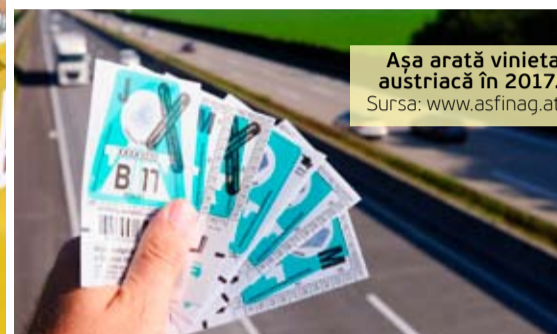
Așa arată vinieta austriacă în 2017.

● Rețeaua de autostrăzi din Germania are o distanță totală de 13 mii de km, fiind una dintre cele mai lungi rețele din lume. Potrivit portalului www.tolls.eu, nu toate cele 28 de state membre ale Uniunii Europene percep taxe de autostradă. Drumurile sunt gratuite în: Andorra, Estonia, Finlanda, Cipru, Liechtenstein, Luxemburg, Malta, Monaco, San Marino și Vatican. Totodată, sunt țări în care se plătesc anumite taxe pentru poduri și tuneluri: Albania, Belgia, Danemarca, Suedia, Lituania și Letonia (pentru vehicule mai mari de 3,5 tone), Islanda, Muntenegru și Olanda.