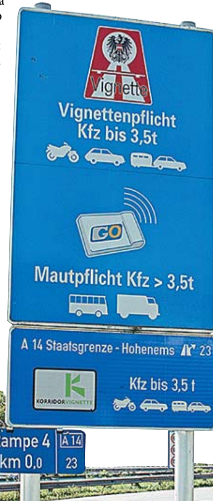
Indicator rutier de taxare în Austria.

de 130 de euro pe an. Valoarea vinietei va fi stabilită în funcție de cantitatea emisiilor CO 2 a automobilului și de perioada pentru care se eliberează. Taxa va fi plătită chiar și de autoturismele înregistrate în Germania, dar ea va putea fi dedusă