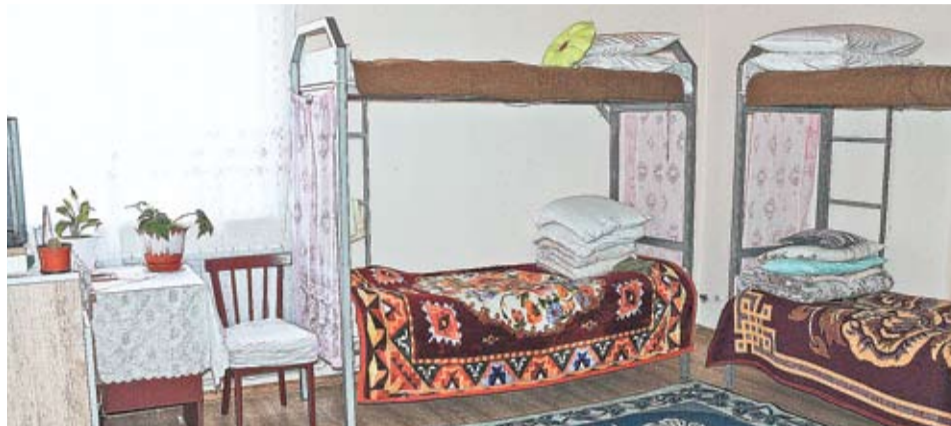
Capacitatea edificiului modernizat de la Rusca este de până la 20 de persoane.

Maria, o altă tânăra deținută, este din raionul Sângerei și își ispășește pedeapsa pentru că, aflându-se la volan, a accidentat mortal un pieton. Chiar dacă, în clădirea ce i-a înlocuit casa pentru un timp, sunt condiții moderne de trai, tânăra de 23 de ani nu uită să ne spună - ca o atenționare pentru toți cei care se află la libertate - că acasă este cel mai bine... „Da, există o mare diferență între camerele noastre și celele „obișnuite” din penitenciar. Totuși, nu-i doresc nimănui să ajungă aici”, adăugă ea emoționată.