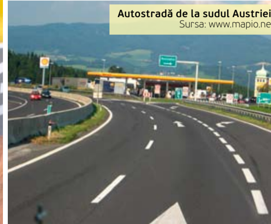
Autostradă de la sudul Austriei.