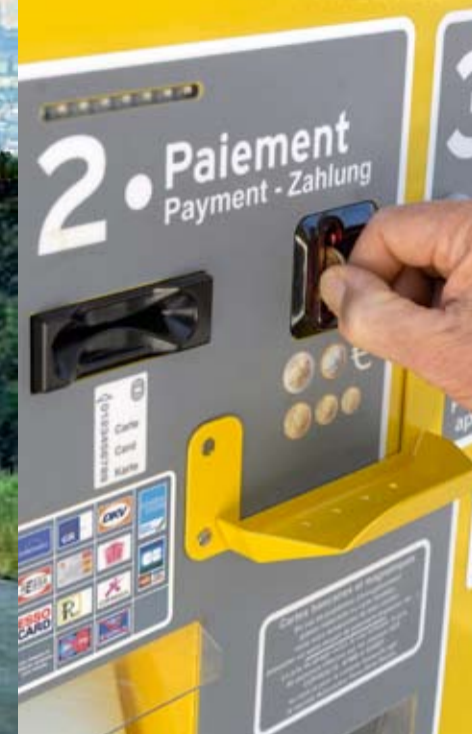
Aparat automat de taxare în Franța.