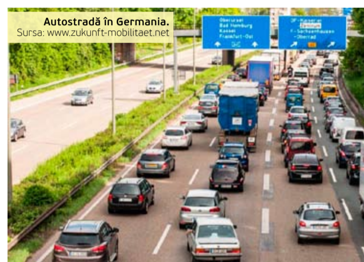
Autostradă în Germania.

Spre deosebire de Austria, în Franța nu există vinieta, dar toate autostrăzile, principalele poduri și tuneluri sunt cu taxă, care este una destul de usturătoare. Excepție fac autostrăzile din jurul orașelor mari și câteva porțiuni de drum din nordul țării. Așadar, fiecare drum are propria taxă, iar unele autostrăzi au și porțiuni care se taxează diferit. Pe porțiuni, sumele plătite oscilează între 20 și 50 de euro. Șoferii pot calcula individual distanțele și taxele ce trebuie plătite, utilizând site-ul www.autoroutes.fr. Trecerea peste podurile și tunelurile importante cere plăți între 2,60 și 43 de euro. Pentru a ajunge din Franța în Anglia, prin celebrul Eurotunnel, șoferii trebuie să achite 23 de euro într-o singură direcție. Totuși, în caz de rezervare prealabilă pe eurotunnel.com, sunt accesibile și unele reduceri. Plățile sunt colectate la stațiile de taxare, dar și prin sisteme electronice automate. Taxa se poate plăti în numerar (euro, lire sterline, dolari, franci elvețieni) sau cu cardul, potrivit www.tolls.eu. Dacă mergeți frecvent în Franța, puteți utiliza sistemul automat de achitare Liber-t, care nu necesită tichete, numerar sau cărți de credit. Sistemul este carac-