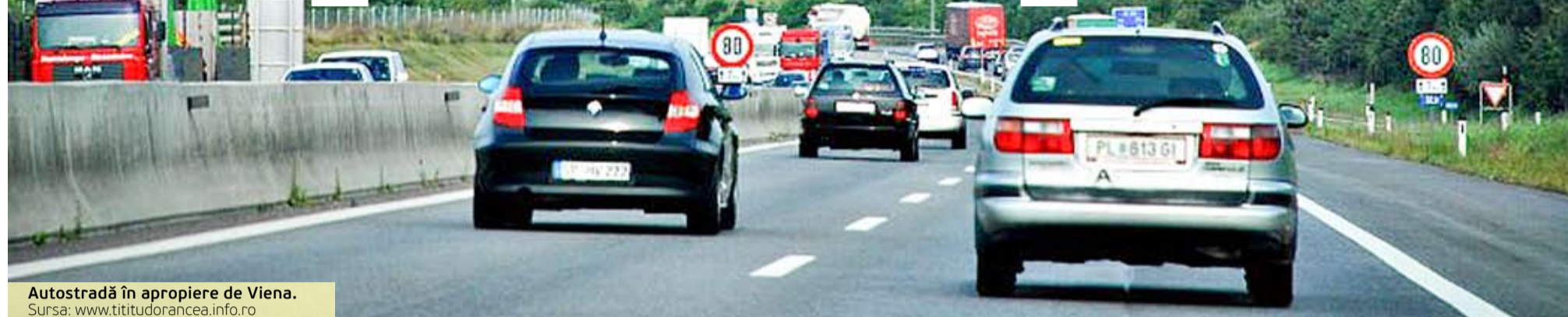
Autostradă în apropiere de Viena.