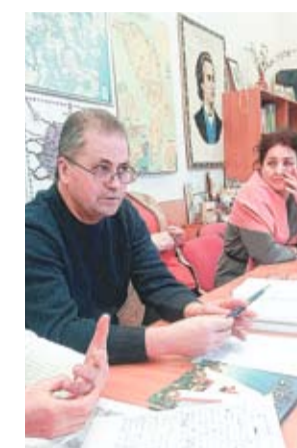
În acest an niciun „elev” nu a scris dictarea la limba română în grafie chirilică

De șapte ani, moldovenii stabiliți la Vilnius, capitala Lituaniei, îl omagiază pe poetul Grigore Vieru, scriind o dictare în limba română. Datorită acestui exercițiu, spun ei, cu fiecare an, greșelile pe care le comit la scriere sunt tot mai puține. În plus, dictarea este pentru ei și un prilej de a depăna amintiri despre „prima patrie”.