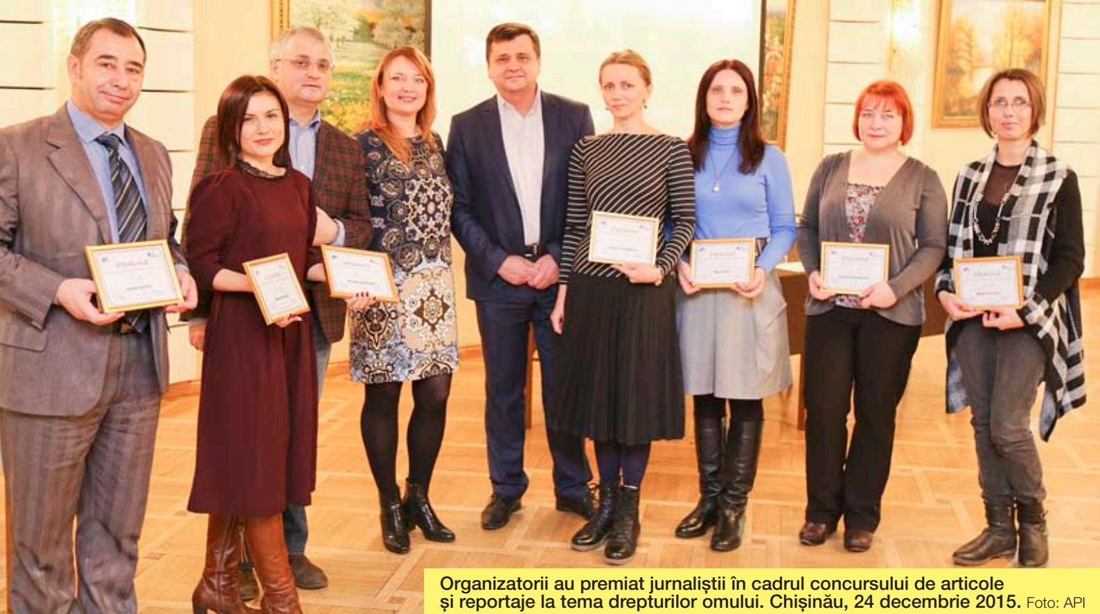
Organizatorii au premiat jurnaliștii în cadrul concursului de articole și reportaje la tema drepturilor omului. Chișinău, 24 decembrie 2015.