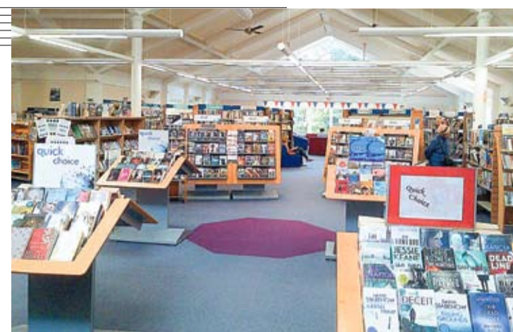
Библиотека города Фарнхейм, Англия.