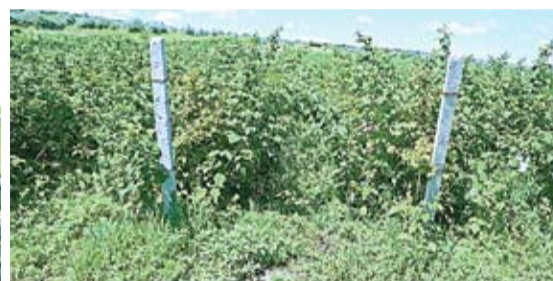
Шпалеры и проволоку на сооружение опоры для малиновых кустов были куплены за счет помощи, предоставленной Данией