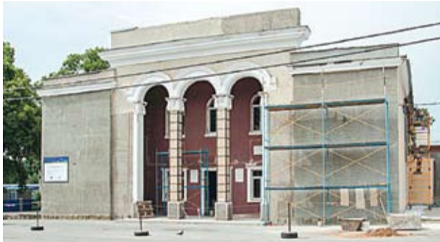
Центр творчества города Дубэсарь: процесс реабилитации в полном разгаре