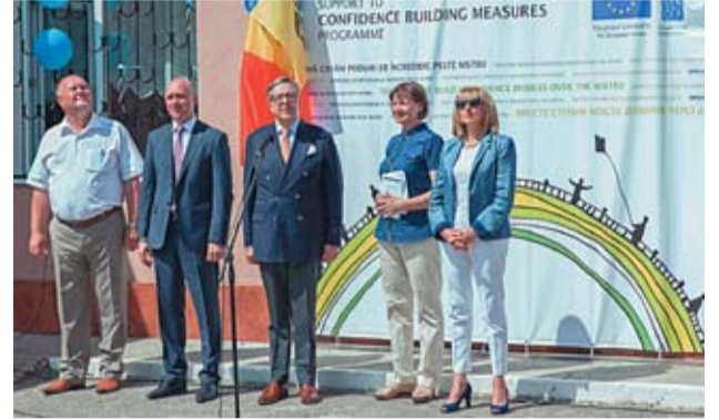
Посол Пиркка Тапиола и премьер Павел Филип на церемонии открытия комплекса

Присутствовавший на церемонии открытия комплекса посол Европейского союза в нашей стране Пиркка Тапиола отметил, что открытие спортивной площадки именно в период проведения Чемпионата Европы по футболу – событие символическое и вдохновляющее: «Следя за спортивными соревнованиями или занимаясь спортом, мы проникаемся ценностями дружбы, уважения и взаимопонимания. Надеюсь, что все эти моменты будут способствовать объединению людей, живущих на обоих берегах Днестра, и в других ситуациях. Я горжусь тем, что