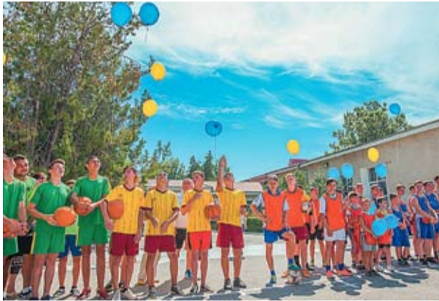
В Варнице дети радуются особенному лету

В настоящее время в населенных пунктах правого и левого берега Днестра ремонтируются 20 объектов социальной инфраструктуры. С момента запуска программы в 2009 году ЕС предоставил более