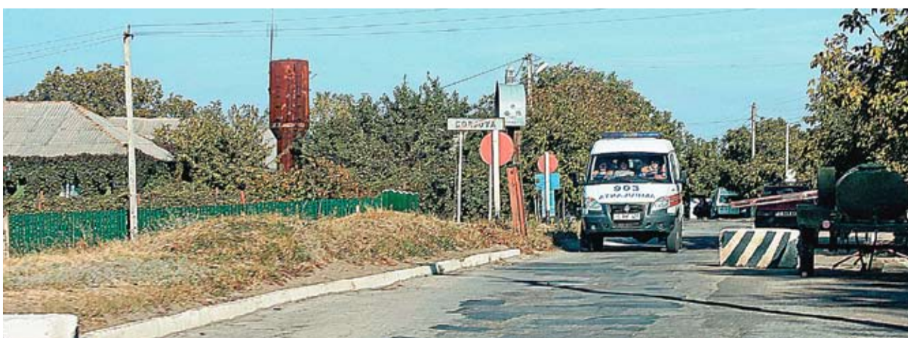
Чтобы добраться до ЦСВ села Кочиерь, жителям Коржова нужно пройти фильтр приднестровской милиции

Для обеспечения сел Молдовы медицинскими работниками, а граждан – качественными медицинскими услугами, за последние годы в нашей стране реабилитированы медицинские центры около 80 сельских населенных пунктов. Это стало возможным, благодаря Проекту «Услуги здравоохранения и социальной помощи в Республике Молдова», внедряемому Министерством здравоохранения при поддержке Всемирного банка. В реабилитацию названных около 80 медицинских центров до сих пор инвестировано 170 миллионов леев. Центры, площадью около 300 квадратных метров, соответствуют международным стандартам для учреждений первичной медицинской помощи и оснащены новым и современным оборудованием.