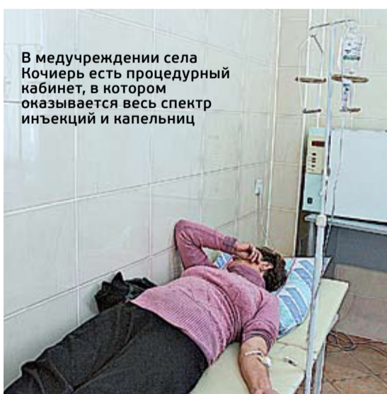
В медучреждении села Кочиерь есть процедурный кабинет, в котором оказывается весь спектр инъекций и капельниц