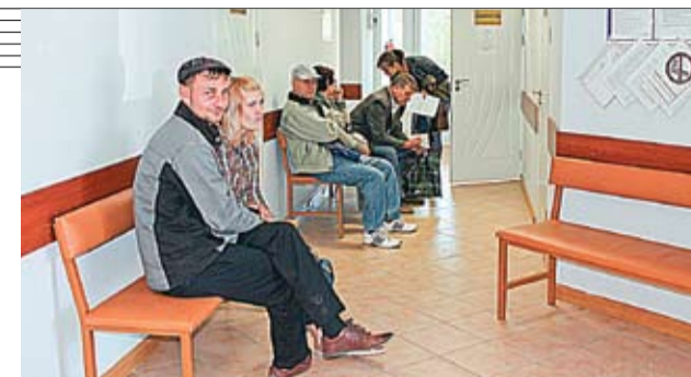
Пациенты ждут своей очереди на прием к врачу

Для обеспечения сел Молдовы медицинскими работниками, а граждан – качественными медицинскими услугами, за последние годы в нашей стране реабилитированы медицинские центры около 80 сельских населенных пунктов. Это стало возможным, благодаря Проекту «Услуги здравоохранения и социальной помощи в Республике Молдова», внедряемому Министерством здравоохранения при поддержке Всемирного банка. В реабилитацию названных около 80 медицинских центров до сих пор инвестировано 170 миллионов леев. Центры, площадью около 300 квадратных метров, соответствуют международным стандартам для учреждений первичной медицинской помощи и оснащены новым и современным оборудованием.