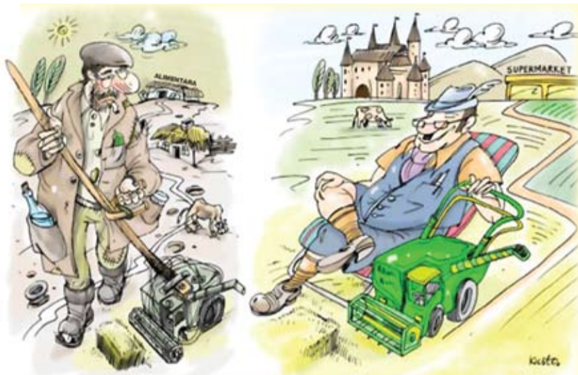
Caricatura: IDIS „Viitorul” și Institute of World Policy (IWP) din Ucraina

Condițiile din satele țărilor dezvoltate ale UE sunt pentru a trăi și nu pentru a supraviețui, așa cum se întâmplă în R. Moldova. Satele europene au infrastructura necesară, acolo există rețele de supermarketuri recunoscute la nivel mondial, îngrijire medicală, drumuri de calitate, școli, posibilitatea de dezvoltare a afacerilor fermierilor. Totodată, în țările din UE se investește foarte mult în agricultură. În cele mai multe țări, fermierii se bazează pe un sprijin guvernamental. În Marea Britanie, de exemplu, ponderea subvențiilor publice pentru producția agricolă depășește 25% și este una dintre cele mai mari din lume.