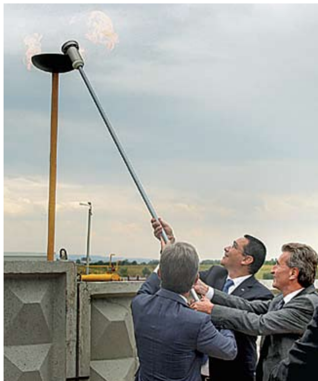
Inaugurarea Gazoductului Iași-Ungheni. Ungheni, 27 august 2014.

Gazoductul Iași-Ungheni a fost inaugurat miercuri, 27 august, chiar de Ziua Independenței Republicii Moldova, de către Premierul Iurie Leancă, de Prim-ministrul României, Victor Ponta, și de către Comisarul European pentru Energie, Günther Oettinger. Cu acest prilej, cei trei oficiali au subliniat că Republica Moldova nu va mai sta niciodată cu frica de a rămâne fără energie.