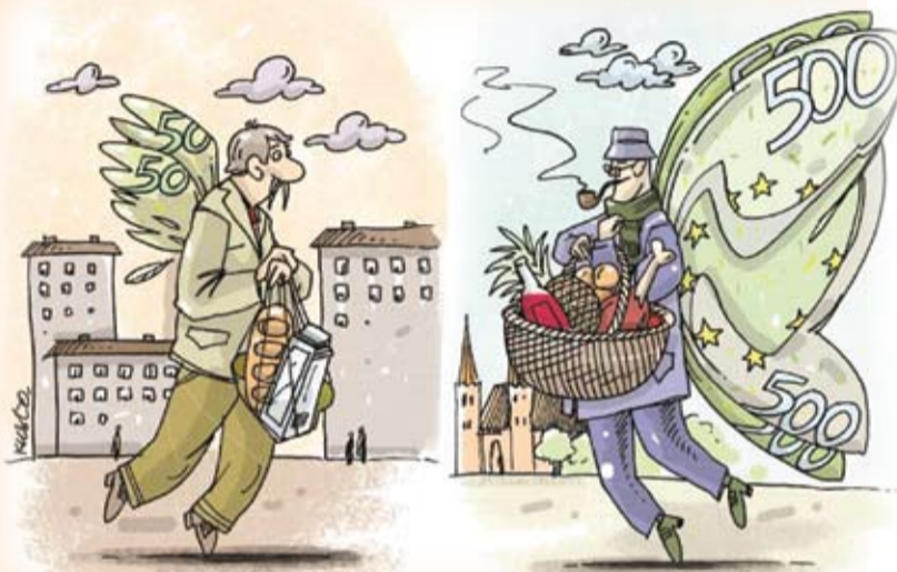
Caricatura: IDIS „Viitorul” și Institute of World Policy (IWP) din Ucraina

Salariul minim în țările Uniunii Europene este net superior celui din R. Moldova. Cu un salariu minim de 84 euro (1.560 de lei), R. Moldova este depășită inclusiv de țările UE cu cele mai mici salarii minime - Bulgaria cu 173 euro, România cu 190 euro. În șase țări din Europa, angajatorii nu pot plăti mai puțin de 1.200 euro lunar: Luxemburg - 1.921 de euro, Belgia - 1.501 euro, Olanda - 1.485 de euro, Irlanda - 1.461 euro, Franța - 1.445 de euro, Marea Britanie - 1.216 euro. Cu un salariu minim, un moldovean își poate cumpăra 1300 de ouă, un spaniol - 5570 de ouă, un austriac - 6890 de ouă.