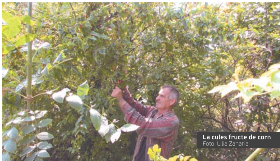
La cules fructe de corn