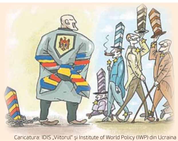
Caricatură: IDIS „Viitorul” și Institute of World Policy (IWP) din Ucraina

În Uniunea Europeană nu există granițe, respectiv oamenii pot călători fără vize și chiar fără pașaport. Toate acestea au devenit posibile datorită creării spațiului Schengen, din care în prezent fac parte 26 de state, urmând să adere România și Bulgaria. Deplasările fără vize permit europenilor din regiunile învecinate nu doar să-și planifice călătoriile în ultimul moment, dar și să meargă la cumpărături, la medic și chiar la frizer în țara europeană vecină, unde calitatea este mai bună sau prețurile sunt mai mici.