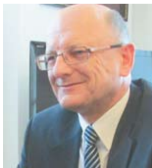
Krzysztof Żuk, primarul orașului Lublin din Polonia

Informația este confirmată de Krzysztof Żuk, primarul orașului Lublin, capitala voievodatului Lubel-