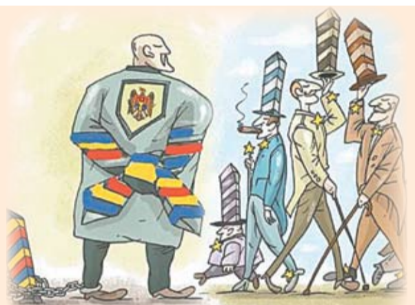
Карикатура: IDIS «Viitorul» и Institute of World Policy (IWP) из Украины

В Европейском союзе нет границ, соответственно, люди могут путешествовать без виз и даже без паспорта. Все это стало возможным благодаря созданию Шенгенской зоны, в состав которой на данный момент входят 26 государств и предстоит присоединиться Румынии и Болгарии. Безвизовый режим позволяет европейцам соседствующих регионов не только планировать свои поездки в последний момент, но даже ездить за покупками, к врачу или просто к парикмахеру в соседнюю европейскую страну, в которой либо качество соответствующих услуг лучше, либо цены ниже.