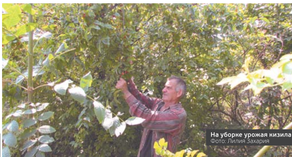
На уборке урожая кизила