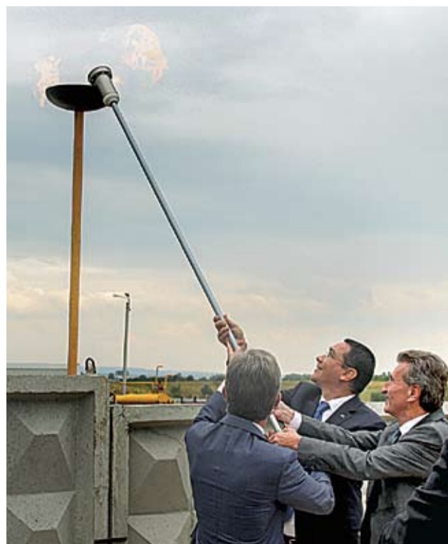
Запуск газопровода Яшь-Унгень. 27 августа 2014 г.

Газопровод Яшь-Унгень был запущен в среду, 27 августа, непосредственно в День независимости Республики Молдова, премьер-министром Румынии Виктором Понта и европейским комиссаром по энергетике Гюнтером Эттингером. На торжественной церемонии сдачи газопровода в эксплуатацию все три высокопоставленных чиновника отметили, что отныне и Республика Молдова навсегда избавится от страха остаться без энергоресурсов.