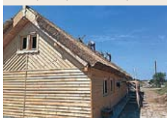
Первый экологический традиционный дом, построенный заключенными в Румынии под руководством местных мастеров.

● В Норвегии осужденные работают, учатся и осознают важность свободы. В Румынии при помощи заключенных было построено традиционное село. В Молдове заключенные не обязаны трудиться, но могут работать в пользу общества ради сокращения срока наказания. Однако этот период не включается в общий трудовой стаж осужденного и не вписывается в трудовую книжку.