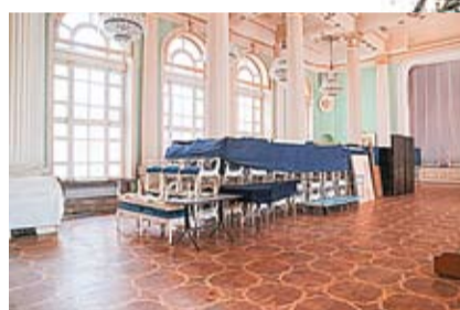
Пока Органный зал на ремонте, меломанов приглашают на концерты в Кишиневский художественный музей.