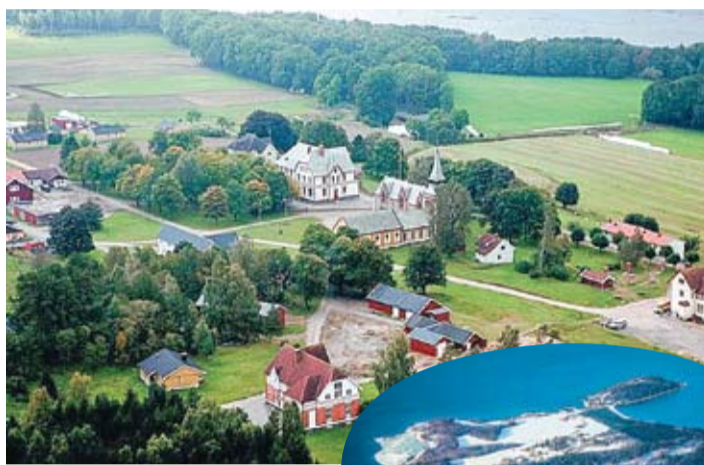
Тюрьма Бастой, вид сверху: сельскохозяйственные угодья, лес и 80 зданий.

Заключенные просыпаются самостоятельно, ходят в школу, гуляют по лесу, плавают или смотрят телевизор. Хотя им запрещено иметь мобильные телефоны, в их распоряжении пять телефонных кабинок, отмечается на блоге victorkapra.ro . Что касается трудовой деятельности, то каждый может выбрать то, что ему больше всего по душе из широкого перечня работ – пасти овец, ухаживать за лошадьми, выращивать овощи и фрукты, убирать, красить дома, работать в столярной мастерской. Работа обеспечивает им ежемесячный доход. На заработанные деньги они могут покупать продукты в местном магазине и готовить себе еду. Авторы этого метода убеждены, что таким образом создаются