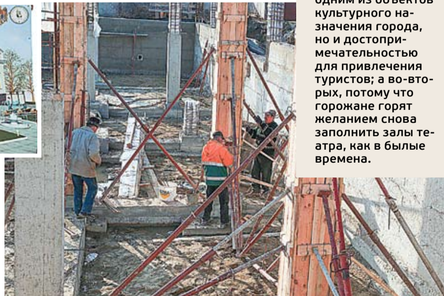
Через год у Кахулского театра будет новый дом, современное и просторное здание.

других театров», – делится воспоминаниями тетушка Галина Жданова.