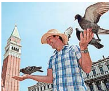
В Венеции запрещается кормить птиц.