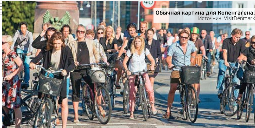
Обычная картина для Копенгагена.