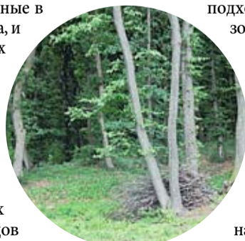
Лесной пейзаж, Богений Ной

Все началось в 2007 году, когда на деньги, предоставленные в рамках японского проекта, и при помощи национальных и международных экспертов в области лесного хозяйства, разработали техническую книгу леса. Фактически, это каталог, составленный по результатам исследования и анализа всех растущих в регионе видов деревьев и кустов, по категориям и возрасту.