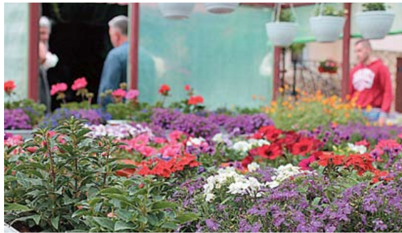
Покупатели выбирают цветы в теплице