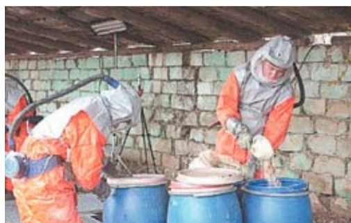
НАТО помогает в обезвреживании и утилизации непригодных пестицидов в Молдове

Республика Молдова и НАТО сотрудничают в области науки и окружающей среды, а также планирования мероприятий по предотвращению чрезвычайных ситуаций. Из числа многочисленных проектов, внедренных при поддержке НАТО в этих сферах, следует отметить подключение Академии наук и Технического университета к сети интернет в 1997 году, ликвидацию последствий сильных заморозков 2000 года или наводнений 2008 и 2010 годов. Помимо этого, ряд других инициатив (внедренных или в процессе реализации) связан с идентификацией, обеззараживанием и последующей утилизацией более 3250 тонн непригодных пестицидов и химических веществ, 362 тонн особо опасного окисляющего жидкого топлива, безопасное обезвреживание более 12000 единиц противопехотных мин и др. Другие проекты связаны с разработкой механизма непрерывного мониторинга и анализа уровня загрязнения воды («Apele Moldovei»); составление региональных сейсмологических карт и определение сейсмоуязвимых участков и зданий («Гармонизация снижения сейсмического риска и угрозы в регионе Вранча») или совместная разработка экспертами Молдовы и НАТО карты подверженности оползневому процессам территории Республики Молдова («Оценка подверженности оползневому процессам в центральной Молдове»).