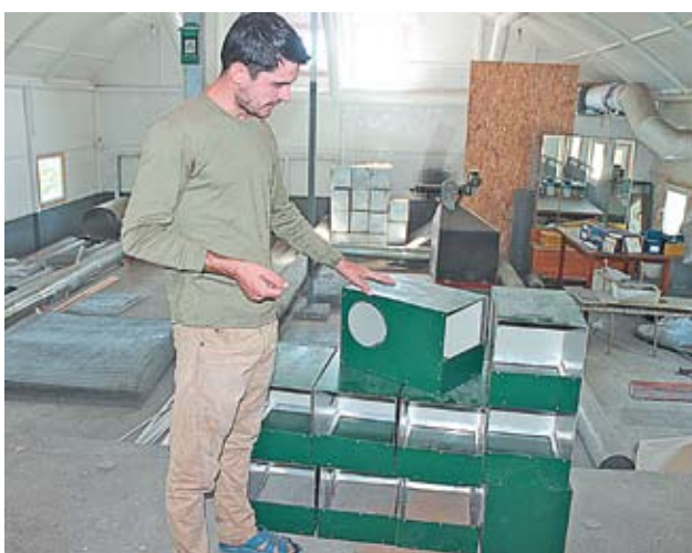
Так выглядит «родильный дом» крольчих.