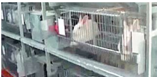
Для Валерия важен комфорт животных. Стоп-кадр: «Istorii urbane»