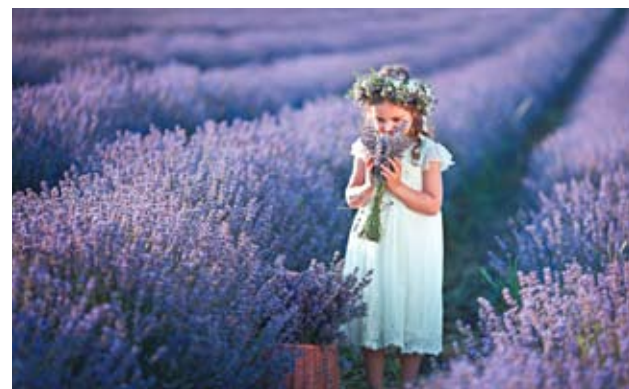
Фестиваль лаванды – 2016 на плантациях села Кобуска-Ноуэ.

некоторых косметических продуктов. Более того, часть этих косметических продуктов, производимых в Европе, «черпают вдохновение» в лаванде, выращенной на полях Молдовы, страны, включенной в рейтинг десяти ведущих производителей лавандового масла на мировом уровне.