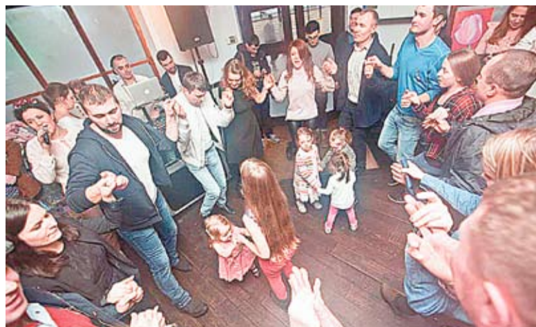
На празднике Мэрцишора в Лондоне не обошлось без народных танцев – молдаване плясали хоры и сырбы.

отметила для издания «Объектив Европа», что подобные мероприятия объединяют людей, делают их более солидарными и восприимчивыми к страданиям других.