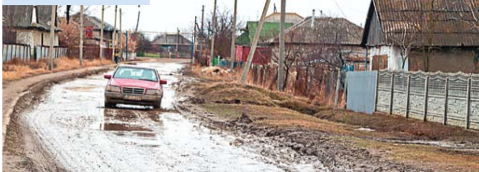
К осени в коммуне Гура Галбенеи дорога будет на уровне европейских стандартов.

бабушка. Я уже большой», – хвастает Лучиан, мальчик из подготовительной группы. Его бабушка, она же воспитательница в детском саду, говорит, что когда мальчик был маленьким, носила его на руках до детского сада, а сейчас внуку приходится самому месить грязь, добираясь до места назначения.