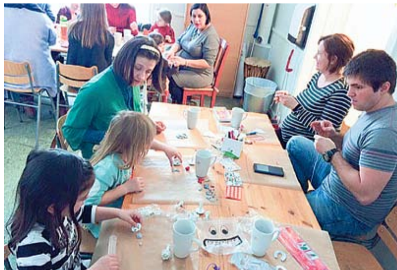
Участники посиделок в городе Осло мастерили мэрцишоры и декорировали чашки.