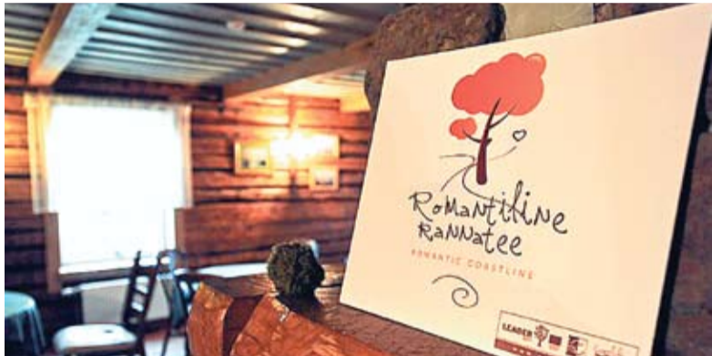
Романтический маршрут включает культурные, исторические и природные достопримечательности.

Анна-Мария Веверица, репортер «Объектив Европа»