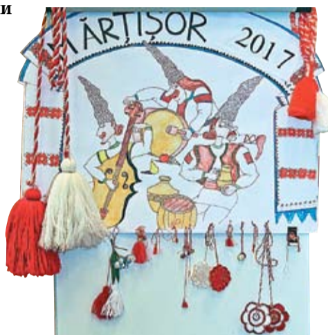
Выставка мэрцишоров, организованная диаспорой молдаван и румын из города Вильнюса, Литва.

Мальши остались в восторге от простоты изготовления мэрцишора. Затем, вместе с родителями, они