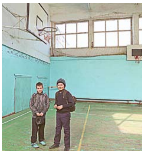
Учащиеся села Крихана Веке уже не занимаются физкультурой в спортзале, крыша которого скорее похоже на решето.

одежда отсыревает. «Если летом дожди шли несколько дней, на полу появлялись грибы. Нет-нет, я не шучу, крыша спортзала не ремонтировалась с тех пор, как он был построен, то есть, с 1980 года», – добавила директор лицея.