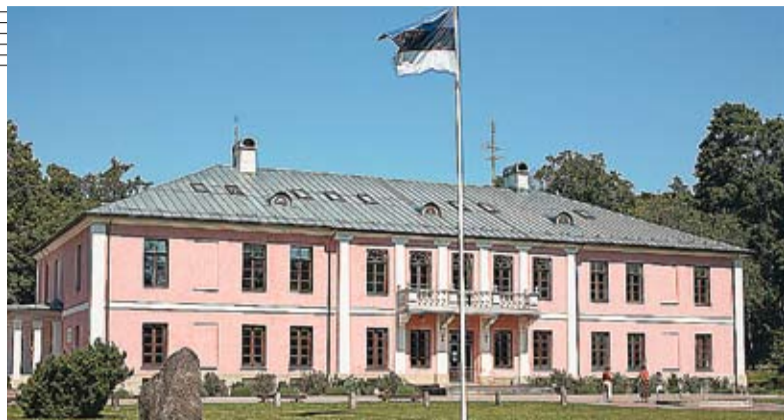
Поместье Тыштамаа стало школой.

этих регионов: фермеры, предприниматели, местные власти и представители гражданского общества. Таким образом и возникли Группы местного действия, доказывающие, что намного эффективнее объединение сообществом своих ресурсов для развития посредством единого видения, материализованного в Стратегии местного развития. При таком подходе ГМД способны лучше сфокусировать внимание на нужды и приоритеты каждого региона, поскольку сами являются его частью. Это мнение разделяют и авторы исследования «Формирование Групп местного действия в селах Республики Молдова – шанс для развития».