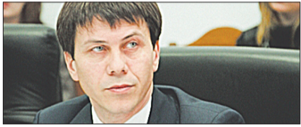
Ministrul Justiției Oleg Efrim, unul din cei nouă membri ai CSM

Șapte judecători acuzați de încălcări în dosarul „Registru”