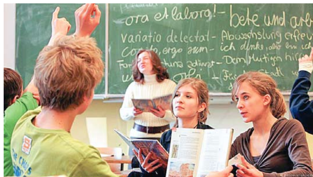
Prima limbă străină studiată în școlile germane este latina.

prin lege, iar întregul sistem de învățământ se află în competența landurilor (n.r. - statele federației, în timp ce guvernul federal joacă un rol minor. Astfel, nu există un sistem de învățământ unic în Germania, fiecare land decide politicile sale educative proprii.