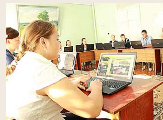
Tehnologia IT, prezentă în clasele liceului de la Ștefănești.