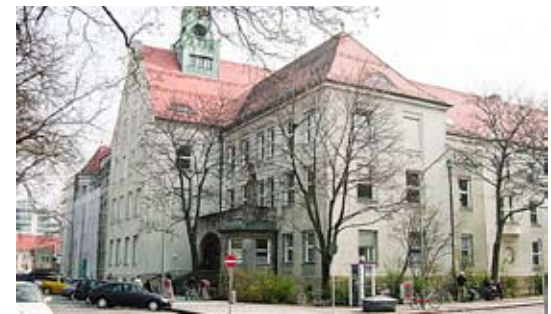
Hallerup. Lecțiile, o joacă pentru elevi.