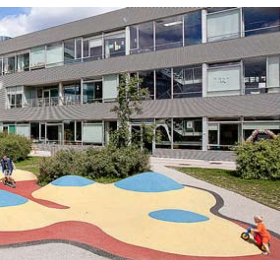
Impresionantul gimnaziu din Wittersbacher.

Educația de calitate este esențială pentru a asigura competitivitatea în lumea globalizată de astăzi. De aceea, educația este o prioritate în Germania, iar școala germană își învață elevii să joace un rol activ în societatea bazată pe cunoștințe. Comparativ cu Danemarca, aici educația la domiciliu este interzisă