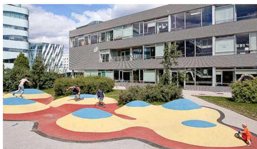
Hellerup. Școala viitorului.

În cele peste 1500 de școli din Danemarca învață astăzi aproape 575 de mii de elevi. Anul de învățământ în Danemarca începe în august și se termină în iunie. Pe pagina oficială a sistemului școlar, Folkskole („Școala poporului” – n.a.) există