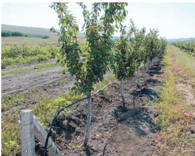
Sistemul de irigare din livada familiei Chișcă