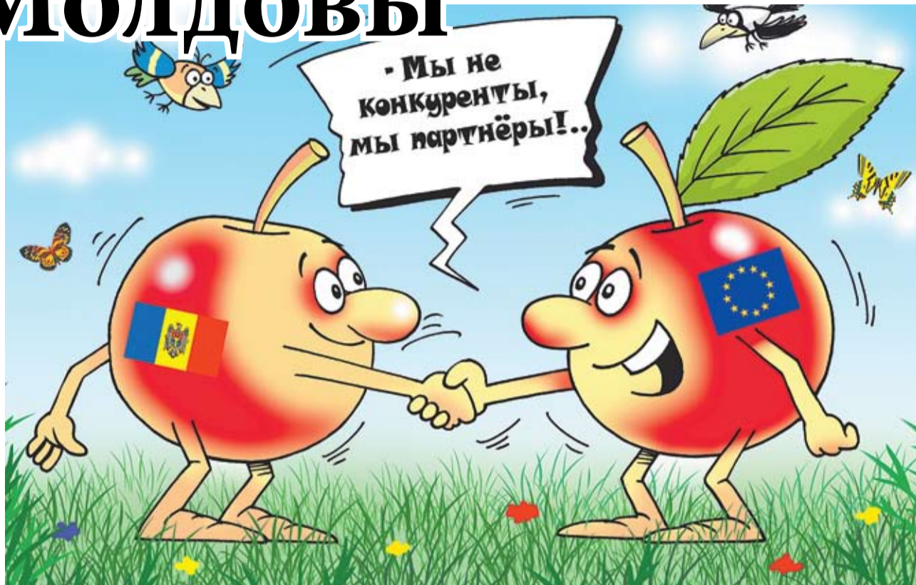
Рисунки: Алекс Димитров

В беседах с земледельцами, комиссар Дачиан Чолош подтвердил тот факт, что кишиневские власти добились в ходе переговоров установления переходного периода сроком от трех до десяти лет для недостаточно конкурентных секторов страны или для