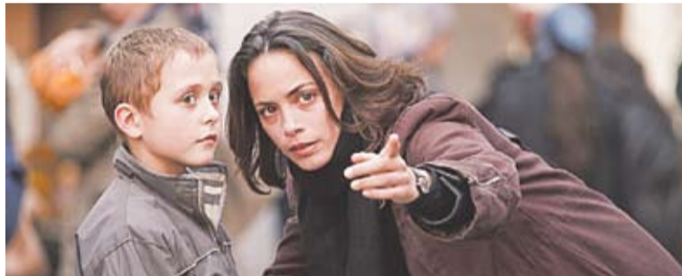
The Search («Поиск») Мишеля Хазанавичуса

«Премия «Медиа» присуждается артистам в целях создания высокохудожественных фильмов, которые будут доступны для просмотра по всей Европе», - подчеркнула Андрула Василиу. Новый полнометражный фильм Даниса Тановича затрагивает тему коррупции. «Действие про-