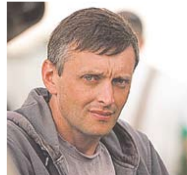
Режиссера фильма «Майдан Незалежности», Сергей Лозница