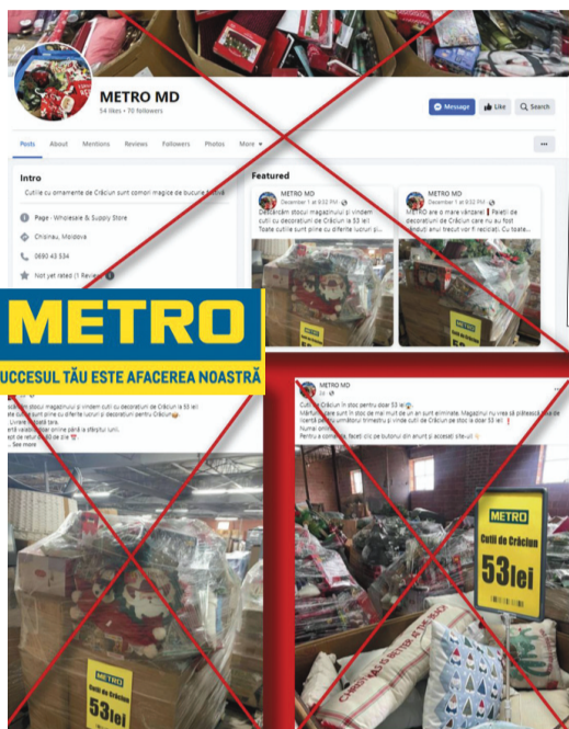
Metro Moldova a atenționat că „promoțiile” de mărfuri la preț de 53 de lei sunt false

Sunt folosite imaginile de brand ale unor renumite companii din străinătate, care fie că au, fie că nu au reprezentanțe în țara noastră, dar și mărcile unor firme din Republica Moldova, inclusiv mall-uri și magazine online din Chișinău. Printre acestea sunt: compania americană Amazon, specializată în comerț electronic, Timberland, un producător american de încălțăminte, dar și Starlink, serviciul de internet prin satelit lansat de o companie deținută de către antreprenorul american Elon Musk. De obicei, mărfurile originale și în cantitățile expuse pe conturile false sunt mult