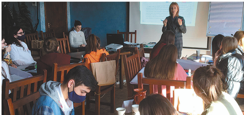
Elevi și eleve de la patru colegii cu profil pedagogic din Republica Moldova au participat la prima ediție a taberei „Stopfals_PedCamp”. Sursa: API

Pentru a vă informa despre COVID-19, dar și despre vaccinare, consultați surse oficiale: platforma Organizației Mondiale al Sănătății (www.who.int), site-urile Ministerului Sănătății, Muncii și Protecției Sociale (www.msmps.gov.md), al Agenției Naționale pentru Sănătate Publică (www.ansp.md), dar și surse mass-media cunoscute și credibile. Pe portalul Stopfals.md sunt publicate dezmințiri ale unor falsuri la aceste teme.