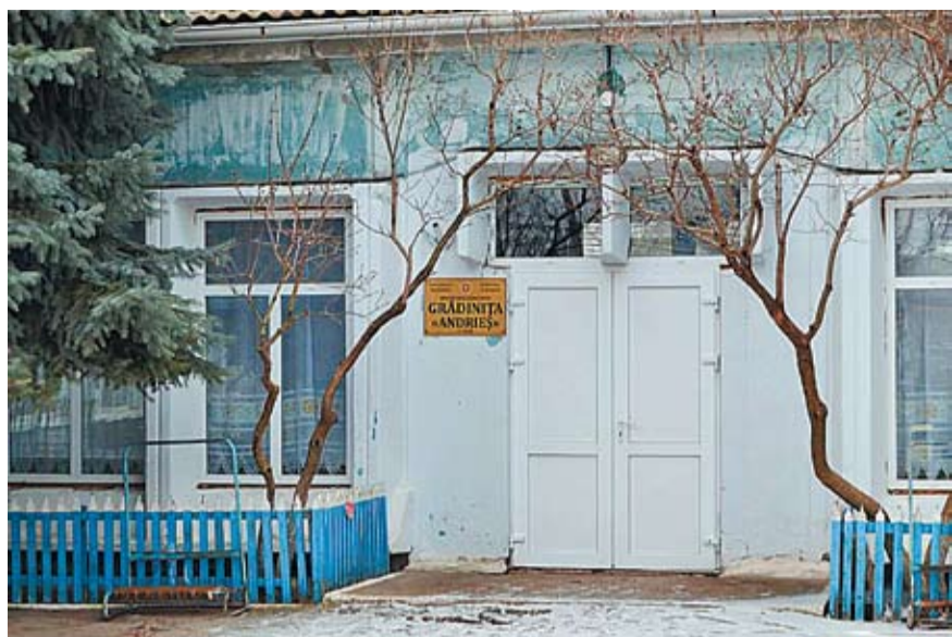
Grădinița „Andieș” din Zaim după reparație.