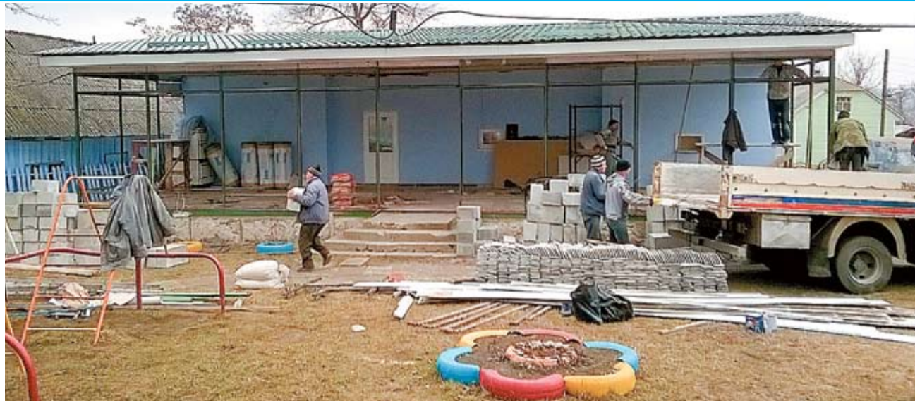
Clădirea anexă în construcție.