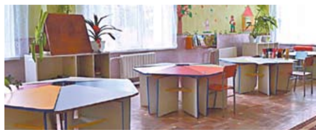
Grădinița renovată din satul Zaim, raionul Căușeni.

Am ajuns la Sadova într-una din zilele când baba Dochia își arunca peste Moldova cojoacele... Afară era frig și ningea. În