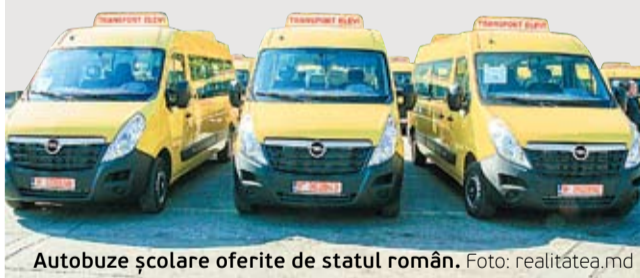
Autobuze școlare oferite de statul român.

Astfel, Teatrului Republican Muzical-Dramatic „Bogdan Petriceicu Hasdeu” din Cahul i-au fost oferite 800 de mii de euro pentru construirea unui nou sediu al instituției. Tot anul trecut, Guvernul României a alocat un milion de euro pentru reabilitarea Sălii cu Orgă din Chișinău și un milion de euro pentru reabilitarea Muzeului Național de Artă a Moldovei. În aceeași perioadă, România a mai donat Republicii Moldova 100 de microbuze școlare, trei autobuze pentru teatre și 35 de autoturisme de teren „Dacia Duster”, pentru instituțiile publice.