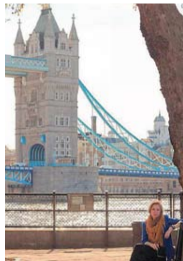
Trecutul lor este ascuns cu grijă în detalii.

SPAȚIUL PERSONAL: Am putea spune că noțiunea de „privacy”