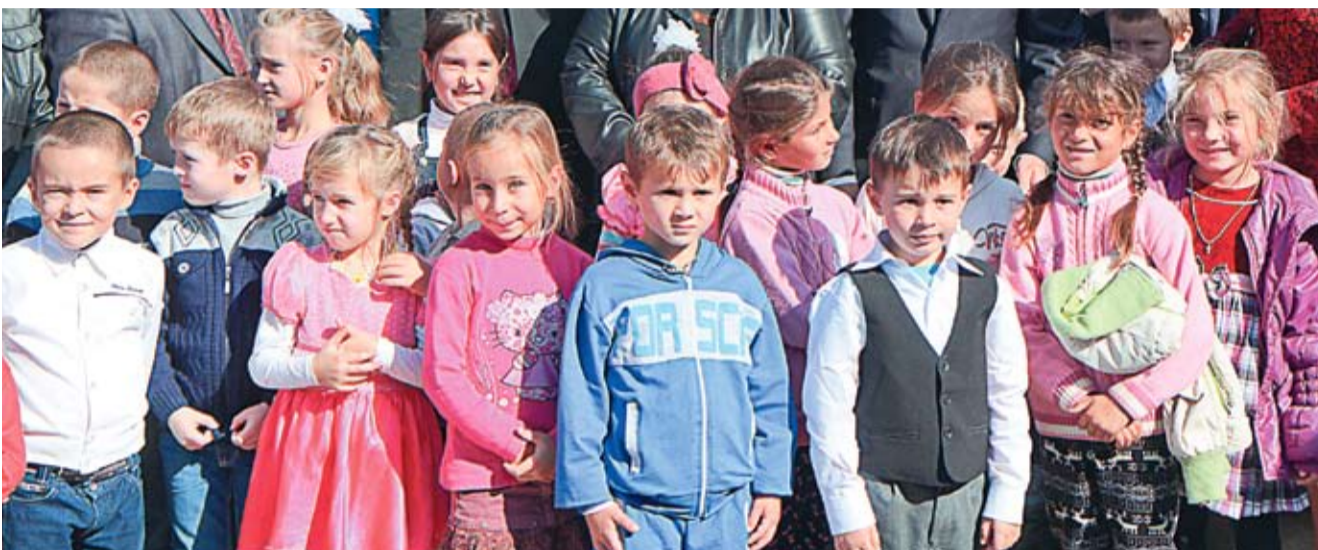
Copiii din satul Porumbestii vor merge la o nouă grădiniță.

...La început de martie, la Tbilisi, reprezentanții Ministerelor de Externe din Georgia, Ucraina și Moldova au convenit ca la Summitul Parteneriatului Estic de la Riga, care va avea loc în luna mai, cele trei țări să aibă o viziune comună. Și anume, să promoveze recunoașterea perspectivelor europene, cât și interesele comune ce derivă din statutul de țări asociate la UE: o susținere mai amplă pentru implementarea Zonei de Liber Schimb (ZLS), accesul sporit la fondurile destinate programelor și agențiilor UE, o implicare mai activă a UE în procesul de soluționare a conflictelor din regiune, integrarea în piața energetică și conectarea la nodurile de transport ale UE. Sunt convinsă că Externele noastre vor face tot ce le stă în puteri pentru a realiza acest scop. Întrebarea e în ce măsură vor reuși însă, având în spate o țară condusă de Baba Hârca?..