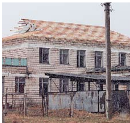
La Sipoteni se construiește o nouă grădiniță