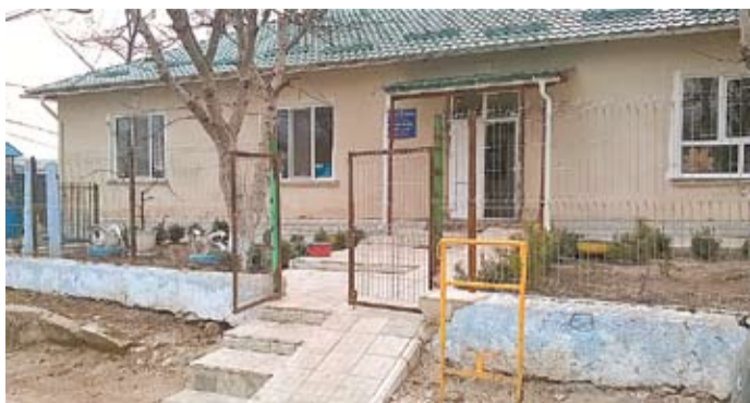
Grădinița din Gordinești