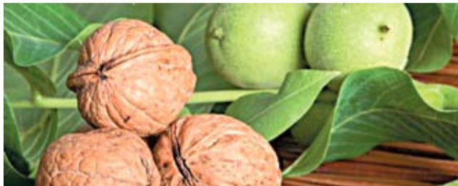
Din miezul de nucă se extrage un ulei fin cu întrebuințări multiple