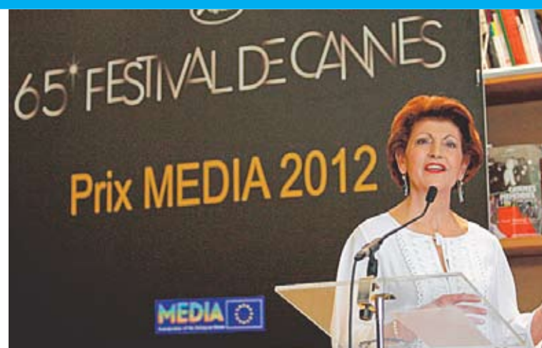
Comisarul Androulla Vassiliou