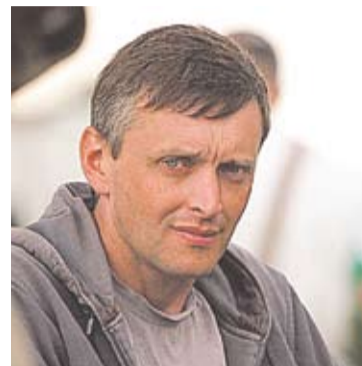
Regizorul documentarului Maidan Nezalejnosti , Serghei Loznitsa