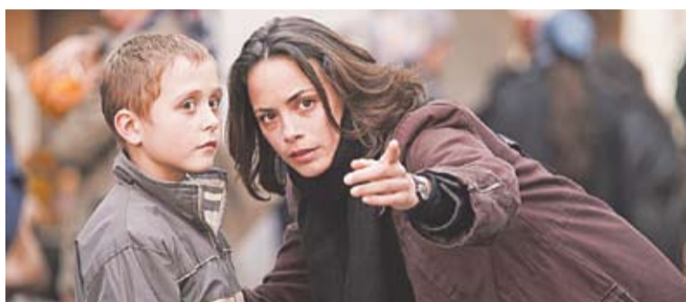
The Search de Michel Hazanavicius

„Premiul Media se atribuie artiștilor în scopul realizării unor filme de înaltă valoare artistică ce vor putea fi vizionate în toată Europa”, a subliniat Androulla Vassiliou. Noul lung-metraj al lui Danis Tanovic abordează tema co-