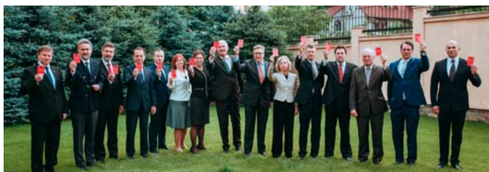
Послы государств - членов ЕС предъявляют «красную карточку» за коррупцию в Молдове.

Послы ЕС в Молдове «дисквалифицировали» коррупцию в нашей стране, показав ей «красную карточку». Эксперты считают, что этот сигнал должен встревожить молдавских политиков, ибо фактически «санкция» вынесена нашим властям.