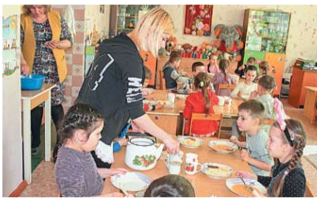
С 1 июня, переработанные мясные продукты исключены из питания детей в детском саду №227.