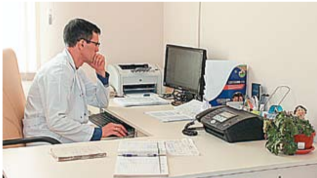
Șeful OMF Cocieri verifică lista pacienților înscriși pentru consultații medicale