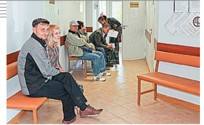
Pacienții își așteaptă rândul pentru a fi consultați de medici

● În ultimii ani, pentru a readuce lucrătorii medicali în satele din Moldova și a le oferi cetățenilor servicii medicale de calitate, în țara noastră au fost reabilitate centrele de sănătate din circa 80 de localități rurale. Acest lucru a fost posibil datorită Proiectului Serviciilor de Sănătate și Asistență Socială în Republica Moldova, realizat de Ministerul Sănătății cu sprijinul Băncii Mondiale. Până în prezent, pentru reabilitarea celor circa 80 de centre, au fost alocate 170 de milioane de lei. Cu o suprafață de circa 300 de metri pătrați, centrele corespund standardelor internaționale moderne, valabile pentru instituțiile de asistență medicală primară și sunt dotate cu echipament nou și modern.