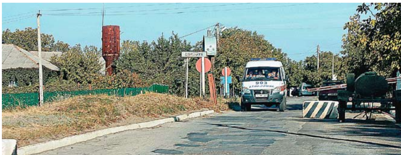
Pentru a ajunge la OMF din Cocieri, locuitorii din Corjova trebuie să treacă de filtrul miliției transnistrene

● În ultimii ani, pentru a readuce lucrătorii medicali în satele din Moldova și a le oferi cetățenilor servicii medicale de calitate, în țara noastră au fost reabilitate centrele de sănătate din circa 80 de localități rurale. Acest lucru a fost posibil datorită Proiectului Serviciilor de Sănătate și Asistență Socială în Republica Moldova, realizat de Ministerul Sănătății cu sprijinul Băncii Mondiale. Până în prezent, pentru reabilitarea celor circa 80 de centre, au fost alocate 170 de milioane de lei. Cu o suprafață de circa 300 de metri pătrați, centrele corespund standardelor internaționale moderne, valabile pentru instituțiile de asistență medicală primară și sunt dotate cu echipament nou și modern.