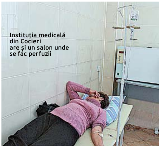
Instituția medicală din Cocieri are și un salon unde se fac perfuzii