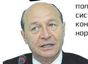
Траян Бэеску, Президент Румынии

«Наибольшим риском для Молдовы в процессе интеграции в Европейский союз является политический контроль судебной системы, а если правосудие под контролем, государство не может нормально функционировать».