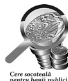
Cere socoteală pentru banii publici!

Potrivit art.27 (4) al Legii Nr.96 din 13.04.2007 privind achizițiile publice , caracteristicile tehnice din caietul de sarcini nu trebuie să facă referință la o anumită marcă comercială sau la un anumit agent economic, la un brevet, o schiță sau un tip de bunuri, de lucrări și de servicii, nu vor indica o origine, un producător sau un operator economic concret.