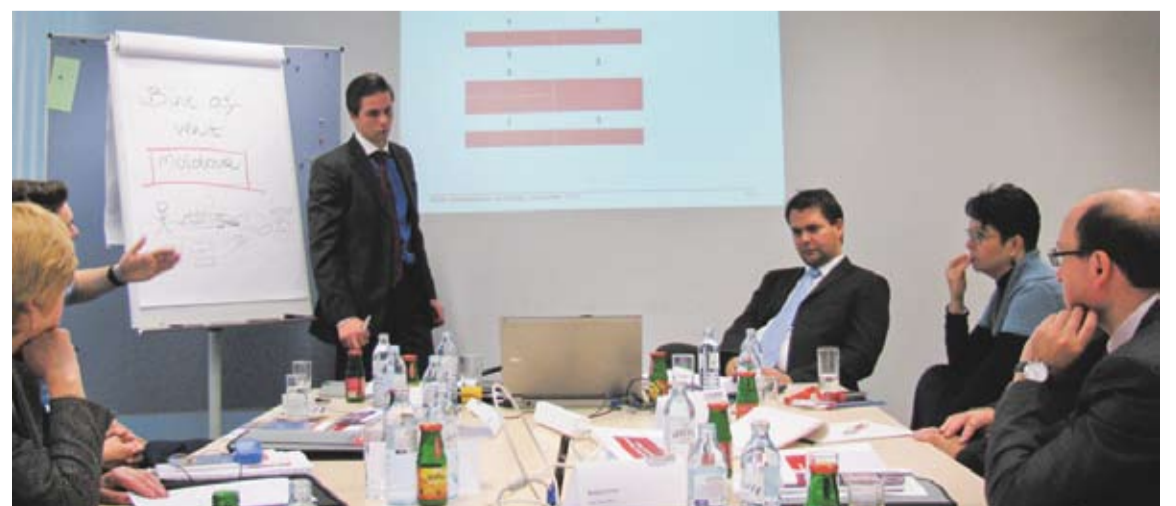
Discuții aprinse: modernizarea și europeanizarea serviciului public