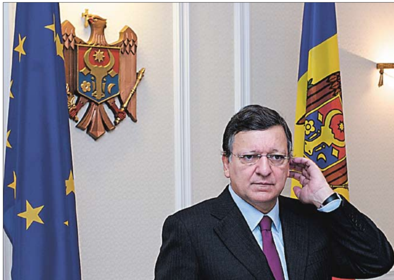
Bateți și vă vom auzi...

Eu nu mă tem să fiu minoritară, și nu pentru că ar fi la modă. Voi serba Crăciunul pe 25 decembrie pentru că, sunt convinsă, așa o va face și Răzvănel-europeanul. Și așa o fac toți oamenii moderni din Moldova care se mai modernizează... Apropos, interlocutorul meu e „convins” și nu prea pentru că, zice el, își va schimba punctul de vedere doar dacă Guvernul va decide altfel. Dar acesta e deja alt subiect.