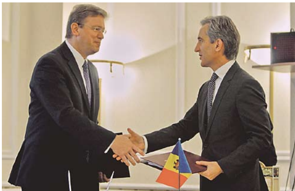
Ministrul de Externe Iurie Leancă și Comisarul european Ștefan Fule

Un element important al vizitei președintelui Comisiei Europene la Chișinău a fost întâlnirea delegației de la Bruxelles cu liderii grupurilor parlamentare. Într-o declarație făcută ulterior, președintele Parlamentului, Marian Lupu, a spus că actuala guvernare va asigura cel mai strict control asupra gestionării banilor veniți de la UE. Și președintele Partidului Liberal, Mihai Ghimpu, consideră că vizita președintelui Comisiei Europene la Chișinău va da un impuls important procesului de integrare europeană a R. Moldova. Iar în ceea ce privește criticile comuniștilor și socialiștilor la adresa guvernării, Mihai Ghimpu sugerează că, așa cum este, guvernarea AIE este cea mai bună pe care a avut-o până acum R. Moldova.