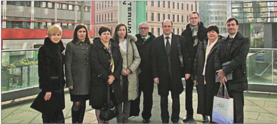
Fotografie de grup - Ministerul Federal al Finanțelor din Austria

O echipă constituită din funcționari ai Cancelariei de Stat și ai altor autorități publice din R. Moldova s-a aflat, în perioadă 19-23 noiembrie 2012, la Viena, la invitația Ministerului Federal al Finanțelor. Scopul delegației moldovenești a fost să cunoască și să preia, în funcție de necesități și posibilități, experiența Austriei în organizarea, gestionarea și reformarea serviciului public al țării.