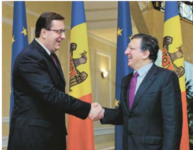
La întrevvedere cu spicherul Marian Lupu

le au fost semnate de către ministrul Afacerilor Externe și Integrării Europene, Iurie Leancă, și Comisarul european pentru extindere, Stefan Fule. Jose Manuel Barroso a menționat că, în acest an, asistența oferită R. Moldova de UE a depășit 122 milioane de euro, volumul asistenței ajungând în prezent la 41 euro pe cap de locuitor, acesta fiind cel mai înalt nivel de sprijin din partea UE pentru țările din vecinătatea europeană.