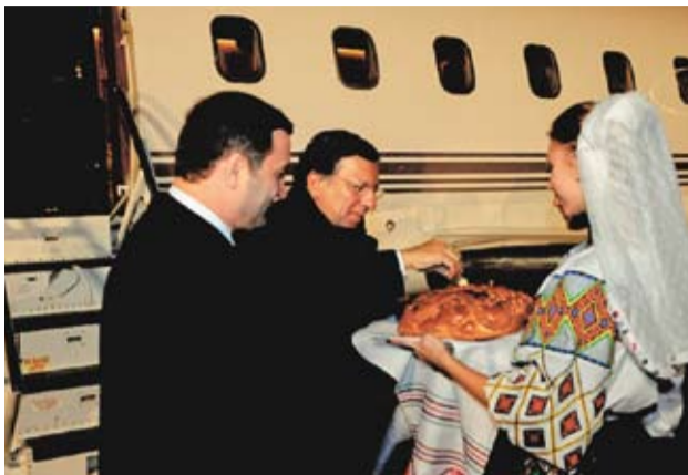
Aeroportul Chișinău. Premierul Vlad Filat îl întâlnește pe Jose Manuel Barroso cu pâine și sare

Ca o apreciere a succeselor înregistrate de R. Moldova în Parteneriatul Estic, în cadrul vizitei lui Barroso la Chișinău au fost semnate două acorduri, prin care UE mărește cu 11 milioane de euro asistența acordată sectoarelor sănătate și educație. În anul viitor, partenerii europeni vor suplimenta cu șase milioane de euro volumul de asistență bugetară pentru reforma în sectorul de ocrotire a sănătății, pentru a moderniza serviciile în domeniul sănătății publice și pentru a îmbunătăți instruirea personalului care activează în acest domeniu. În același timp, cinci milioane de euro vor fi alocate în calitate de asistență tehnică domeniului educației și instruirii vocaționale, prin care se va urmări îmbunătățirea acestui sector în R. Moldova prin reformarea rețelelor instituționale și îmbunătățirea calității procesului educațional, în corespundere cu cererile pieței de muncă. Acorduri-