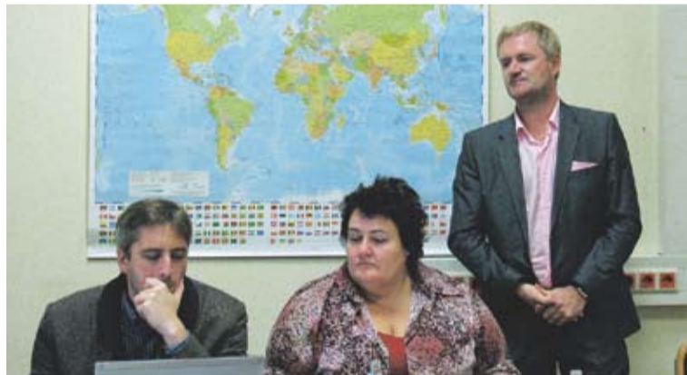
Despre posibilități de colaborare, cu echipa Agenției pentru Integrare Europeană în domeniul economic