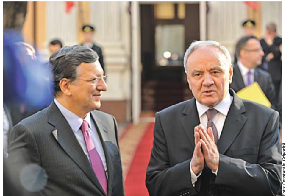
Președintele Nicolae Timofti: Sunt convins că locul Moldovei este în Europa

În replică parcă, opoziția parlamentară a venit cu critici la adresa guvernării. Astfel, deputații Partidului Socialiștilor au declarat că guvernarea AIE este una antipopulară și că ar delapida fondurile oferite de Uniunea Europeană. Iar liderul socialiștilor, Igor Dodon, i-a adresat lui Jose Manuel Barroso o scrisoare deschisă, în care îi cere oficialului european să accepte ieșirea R. Moldova din Pachetul Energetic III, pe motiv că acesta ar putea strica relațiile Chișinăului cu Federația Rusă. Cireașa de pe tort a fost pusă de liderul comuniștilor, Vladimir Voronin. El pur și sim-