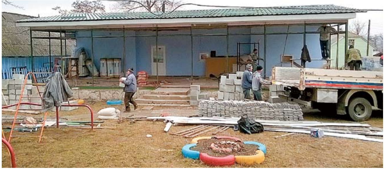
Пристройка к зданию детсада в процессе строительства.