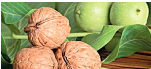
Из ядра ореха добывается нежное масло