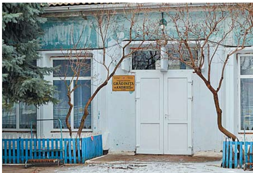
Детский сад «Андреш» в селе Заим после ремонта.