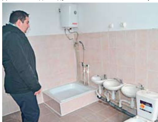
Санузел в детсаде села Заим после ремонта.