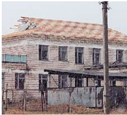
В Сипотень строится новый детский сад.