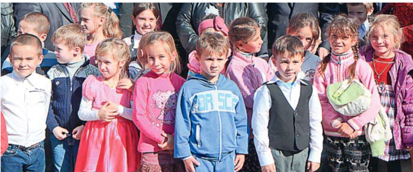
У детей из села Порумбешть будет новый садик.

...В начале марта, в Тбилиси, представители министерств иностранных дел Грузии, Украины и Молдовы договорились об единой позиции этих трех стран на Саммите Восточного партнерства в Риге, который состоится в мае. А именно, продвигать признание европейской перспективы, а также общих интересов, вытекающих из статуса ассоциированных стран с ЕС: более интенсивная поддержка по внедрению Зоны свободной торговли, повышенный доступ к фондам программ и агентств ЕС, более активное участие ЕС в урегулировании региональных конфликтов, интеграция в энергетический рынок и подключение к транспортным узлам ЕС. Убедена, что наше ведомство иностранных дел сделает все, что в его силах, для реализации этой цели. Вопрос, однако, в том, в какой мере им это удастся, когда за спиной страна, в которой балом правит Баба Яга?..