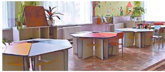
Обновленный детский сад в селе Заим района Кэушень.

В Садова приехала в один из дней, когда баба Евдоха трусила свои тулупы над Молдовой... Было холодно и шел снег. Однако в детском саду было тепло, даже жарко. Время