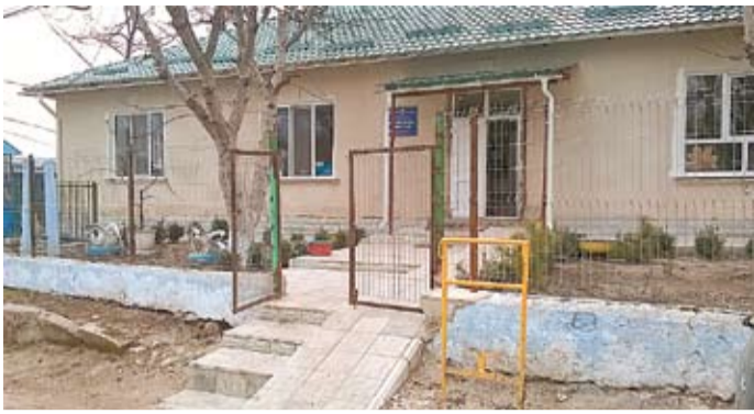
Детский сад в Гординешть