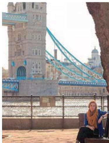
Их прошлое тщательно скрыто в деталях.

Наверное, можно утверждать, что понятие «частная жизнь» изобретено англичанами. В Великобритании чрезвычайно важно личное пространство и его соблюдение. Это остров населенный другими островами. Архипелаг, состоящий из конфиденциальности, интимности и тайн. В отличие от гостеприимства людей из Республики Молдова. Англичане соблюдают вежливое расстояние, и личные вопросы считаются табу. Некоторые могут посчитать их недружелюбными, холодными и сдержанными, но это говорит лишь о том, что они воспитаны таким образом, чтобы обеспечить окружающим психологический комфорт и прекрасное чувство спокойствия.