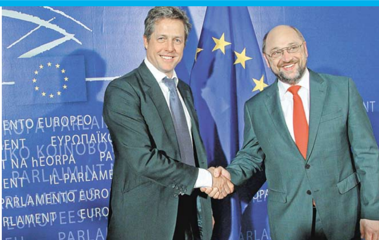
Inițiativa Europeană pentru Pluralismul Mass-Media este susținută de oameni politici, dar și de vedete. Astfel, în aceeași zi, inițiativa a fost semnată de Martin Schulz, președintele Parlamentului European (dreapta), și de actorul britanic Hugh Grant (stânga).