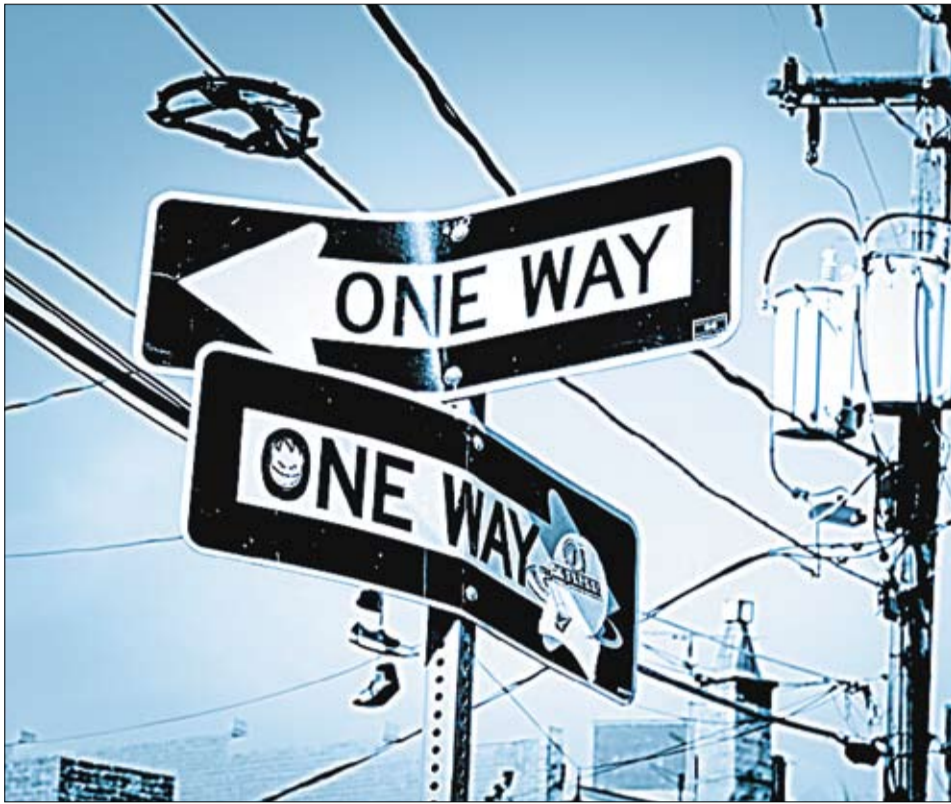
Politicile publice sunt cele care stabilesc direcțiile și modalitățile de evoluție a unei țări