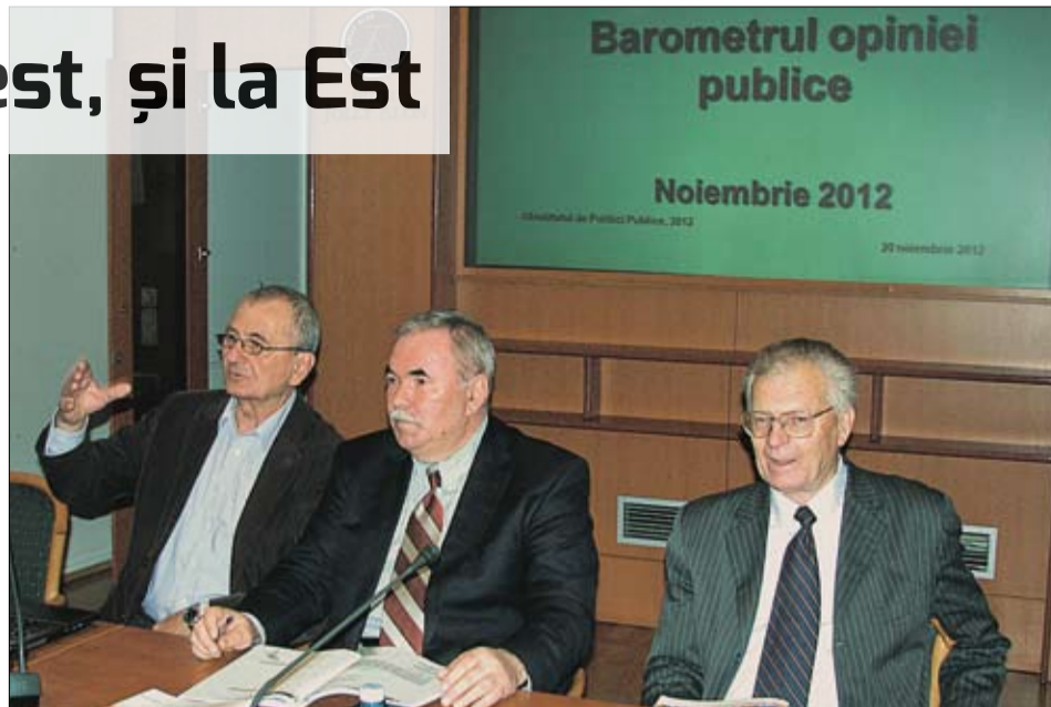
Potrivit autorilor Barometrului, moldovenii sunt mai pesimiști în prag de iarnă, decât erau în primăvară, când a fost realizat Barometrul precedent, de aici și creșterea nivelului de nemulțumire...

Mai bine de jumătate dintre cei care privesc televizorul se informează cel mai des de la „Prime TV”, care retransmite în mare parte programele postului public din Rusia, „Pervii Kanal”. Postul public „Moldova 1” este pre-