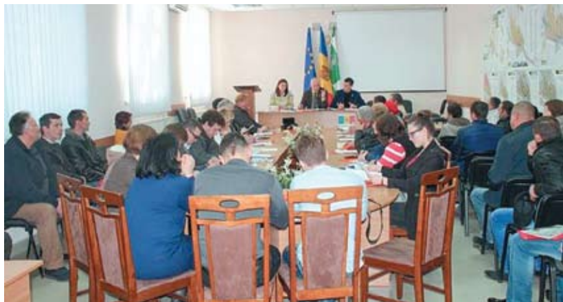
Фотосюжеты с публичных консультаций