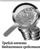
Требуй отчета бюджетным средствам!

№96 от 13.04.2007, технические характеристики не должны содержать ссылки на конкретную торговую марку или конкретный хозяйствующий субъект, патент, эскиз или вид товара, работ, услуг, источник их происхождения, конкретного производителя или экономического оператора.