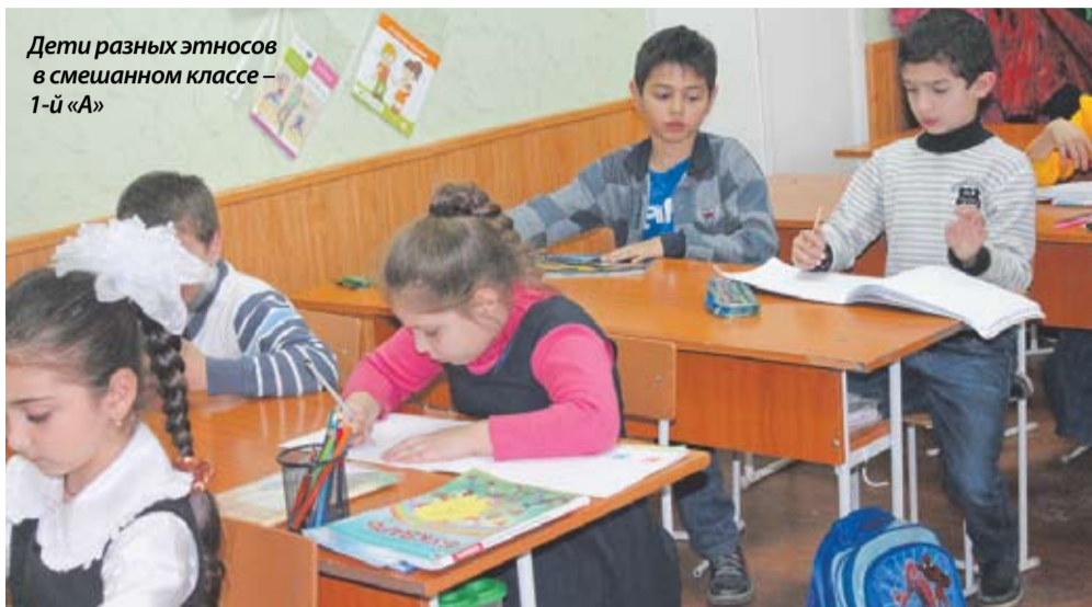
Дети разных этносов в смешанном классе - 1-й «А»

В течение двух лет, администрация Георгиевского лицея им. Михая Эминеску из города Отачь Окницкого района распределяла детей-ромов в отдельные классы. Активисты-правозащитники и представители Национального центра ромов выступили с протестом. По их словам, речь идет о школьной сегрегации - серьезной форме дискриминации. В нынешнем году, первоклашки-ромы учатся вместе со своими сверстниками, представляющими другие этносы и национальности.