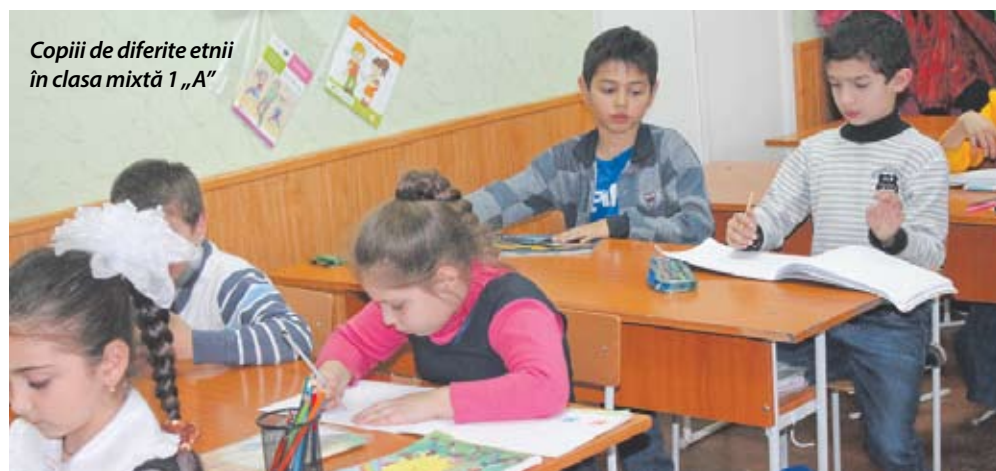
Copiii de diferite etnii în clasa mixtă 1 „A”

Timp de doi ani, administrația Liceului Teoretic „Mihai Eminescu” din orașul Otaci, raionul Ocnița, a repartizat copiii de etnie romă în clase separate. Activiștii în domeniul drepturilor omului și reprezentanții Centrului Național al Romilor au protestat, afirmând că este vorba de segregare școlară – o formă gravă de discriminare. Anul acesta, în clasa întâi copiii romi învață împreună cu cei de alte etnii.