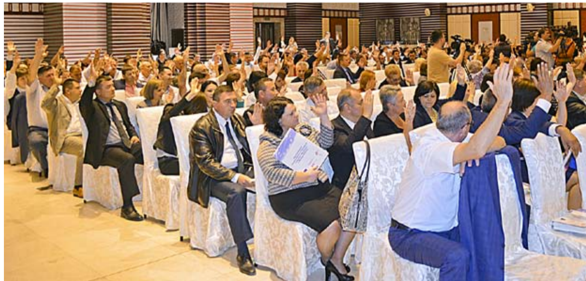
Magistrații adoptă Codul de etică și de conduită profesională a judecătorului, în cadrul Adunării Generale a Judecătorilor.

În Codul precedent judecătorii nu erau obligați să declare