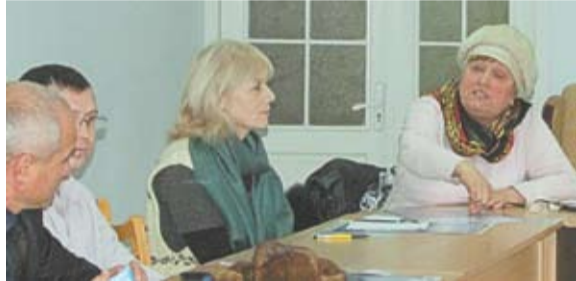
La dezbaterile publice din Rezina

Participanții la dezbateri consideră că una din principalele cauze care generează manipularea informațională din presă sunt interesele proprietarilor acestor instituții mass-media. Totodată, Republica Moldova ar trebui să-și protejeze spațiul informațional de atacurile informaționale și dezinformările care sunt transmise prin intermediul posturilor străine, în special rusești. Astfel, mulți din cei 25 de participanți la dezbaterile publice de la Rezina au spus că problema securității spațiului informațional este foarte actuală în special pentru cetățenii din localitățile limitrofe regiunii transnistrene. „Noi suntem supuși unei manipulări informaționale duble: pe de o parte, deseori ni se prezintă informație selectivă de către mijloacele mass-media naționale, mai ales cele care fac jocul unor partide politice sau a unor politicieni, iar pe de altă parte – din partea mijloacelor media controlate de Tiraspol, în special posturile de radio care emit și în regiunea noastră. Unii oamenii chiar încep să creadă celor auzite zilnic la aceste posturi care promovează doar idei