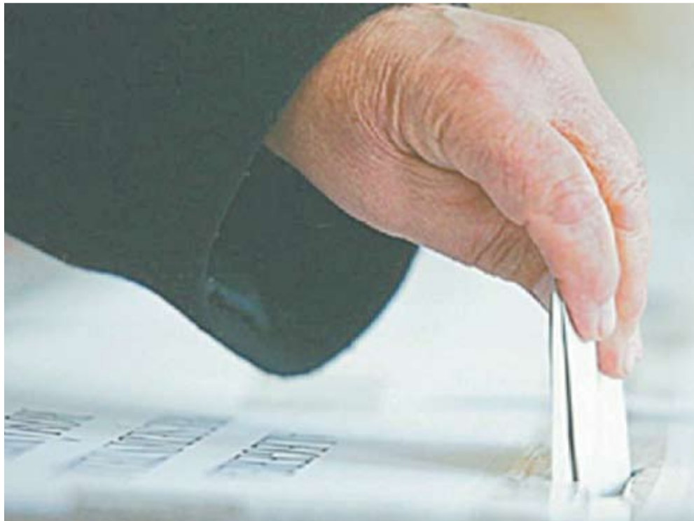
Иллюстрация символ.

Один из наблюдателей на выборах посоветовал этим пациентам пойти в отделение больницы, в котором они госпитализированы, и написать заявление о предоставлении возможности проголосовать с помощью