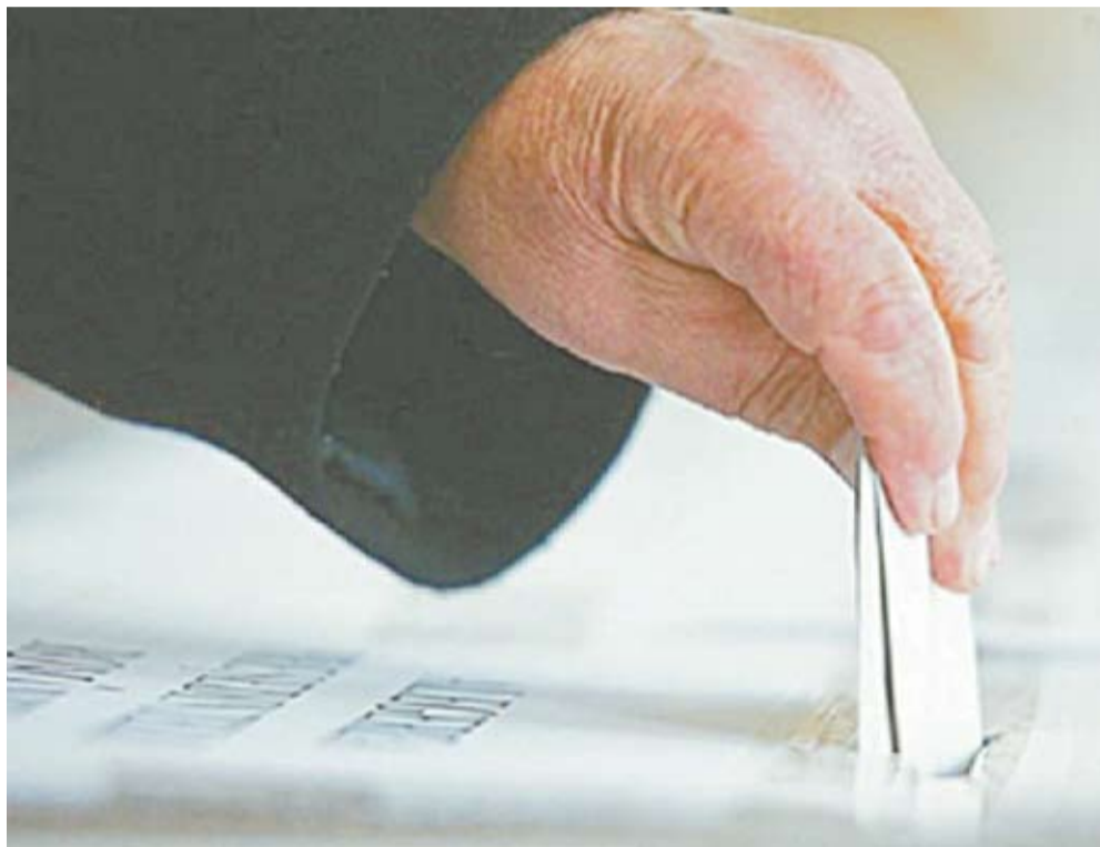
Imagine simbol.

Unul dintre observatorii la alegeri le-a recomandat acestor pacienți să meargă în secția spitalului unde sunt internați și să scrie o cerere pentru a solicita urna mobilă, astfel vor avea po-